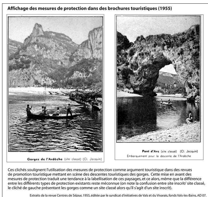
Figure 2 – Affichage des mesures de protection dans des brochures touristiques (1955)