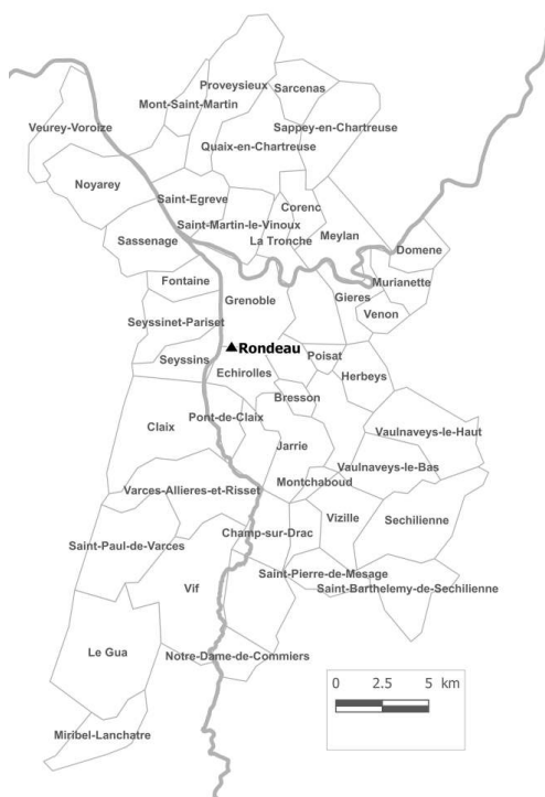
Figure 2 – Localisation du projet « Rondeau » à Grenoble

© IGN, enquête 2015-2016. Réalisé sous Map Info par L. Fontaine & P. Teppe.