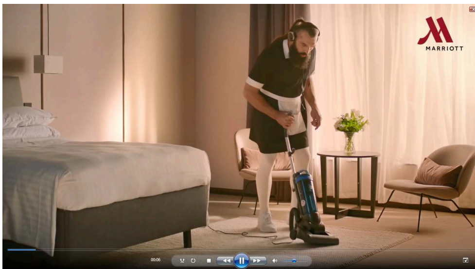
Fig. 3. Publicité Marriott, 2018 (capture d'écran)