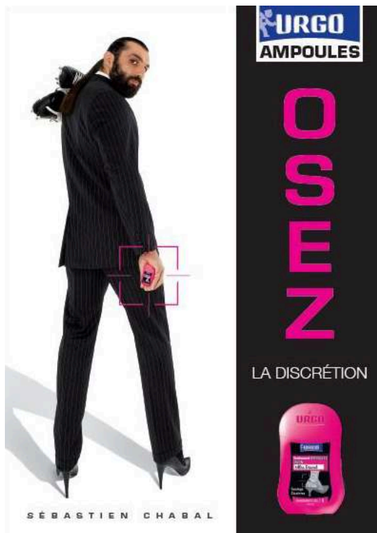
Fig. 4. Publicité Urgo, 2009