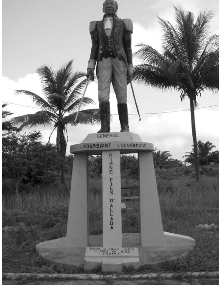
Fig. 3 Mémorial de Toussaint Louverture, Allada, 2005.

Dans l'ensemble, les études qui suivent contribuent à une réflexion autour des formes de recomposition symbolique et rituelle de la relation à l'histoire dans des milieux sociaux où l'expérience de l'esclavage a pu être vécue comme un effacement ou une dispersion des « origines ». Dans ces contextes, le pèlerinage touristique peut renouer avec la logique sémiotique du patrimoine mondial, mais aussi avec le devenir de la religion imaginée comme vecteur de modernité. Ces hybridations peuvent adhérer à un travestissement mythique de l'histoire de l'esclavage, mais elles sont aussi des documents apocryphes de ce passé qui reste à construire. Si on les compare à la recherche d'unanimité à l'œuvre dans les discours institutionnels, les cultes populaires semblent transmettre une mémoire qui n'est pas canonisée par les écritures légales des commémorations officielles. Pourvue d'une perception fluctuante et fatalement partielle de l'époque esclavagiste, la sensibilité rétrospective que les liturgies communautaires expriment est un filtre mémoriel encore actif dans leur