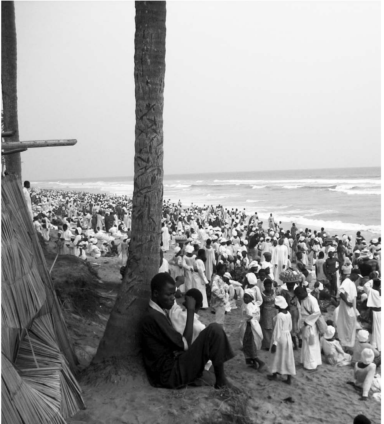
Fig. 1 : Plage de Semé où sont rassemblés les adeptes de l'Église du christianisme céleste, 24 décembre 2005.