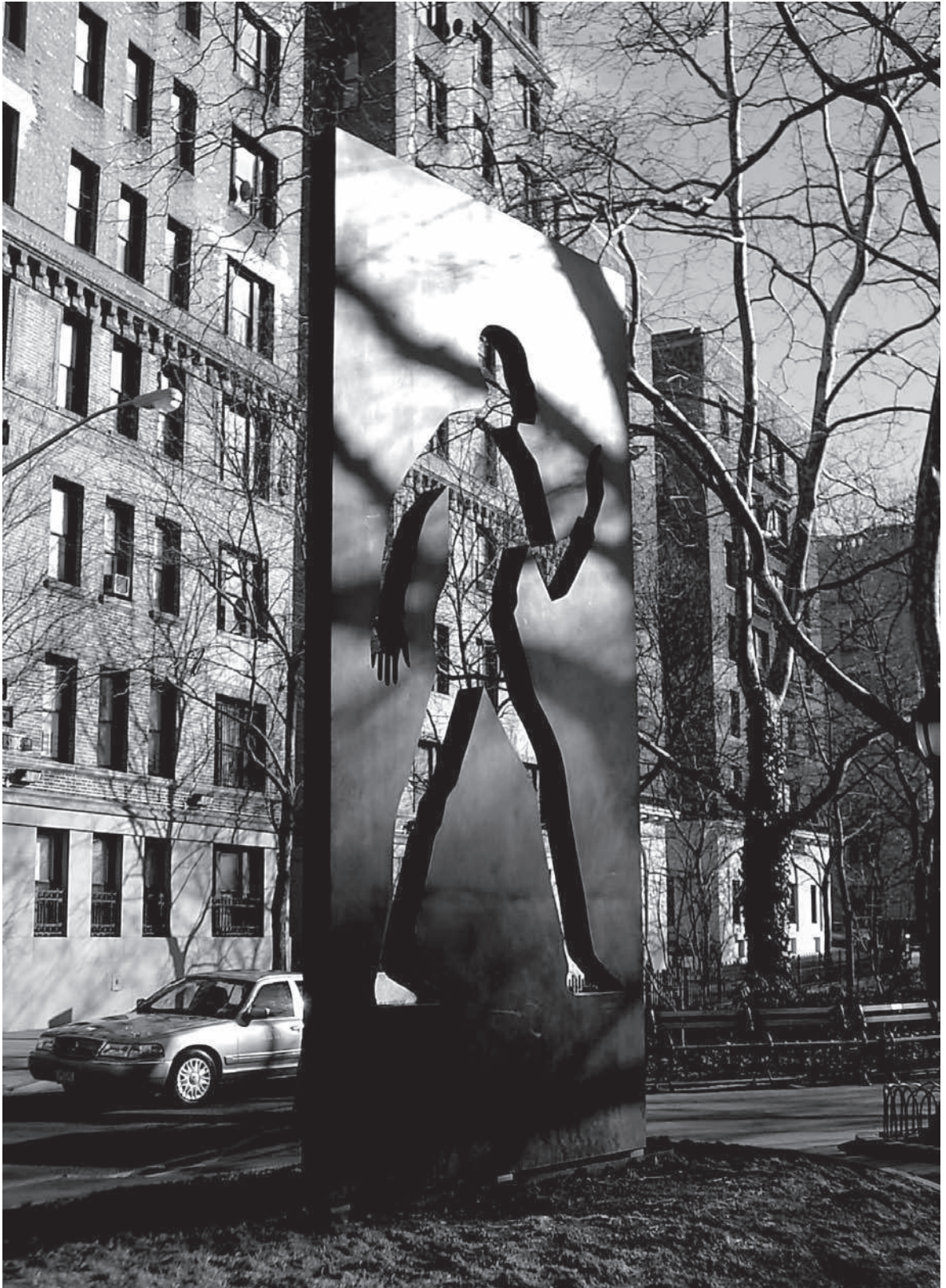
Fig. 12 Mémorial Ralph Ellison, au 730 Riverside Drive, New York City, en bas de son lieu de résidence de 1954 à sa mort en 1994.