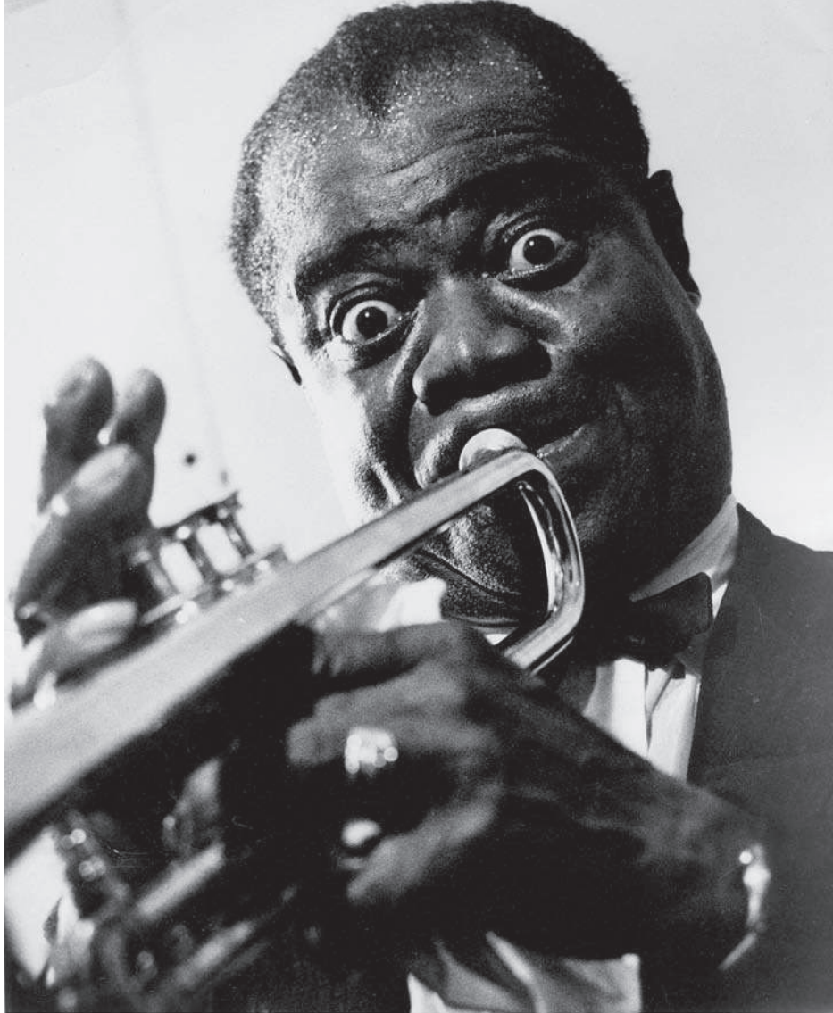
Fig. 11 Louis Armstrong, trompettiste (1901-1971). Les yeux écarquillés sont une convention classique des spectacles de ménestrel, qui traverse l'histoire de la culture populaire américaine. On la retrouve notamment chez Fats Waller et Josephine Baker.

qui n'est [...] jamais totalement soumis, qui est régi par la faim et la soif, condamné à la souffrance et aux blessures, et qui mène des actions autant rusées que stupides. Le désordre fait partie de la vie dans sa totalité [...] et le décepteur est l'esprit de ce désordre. Sa fonction au sein des sociétés archaïques, ou plutôt la fonction de son énonciation mythologique, des contes que l'on colporte sur lui, est d'ajouter du désordre à l'ordre afin d'en faire un tout, et de rendre possible une expérience du prohibé à l'intérieur des limites de ce qui est permis.