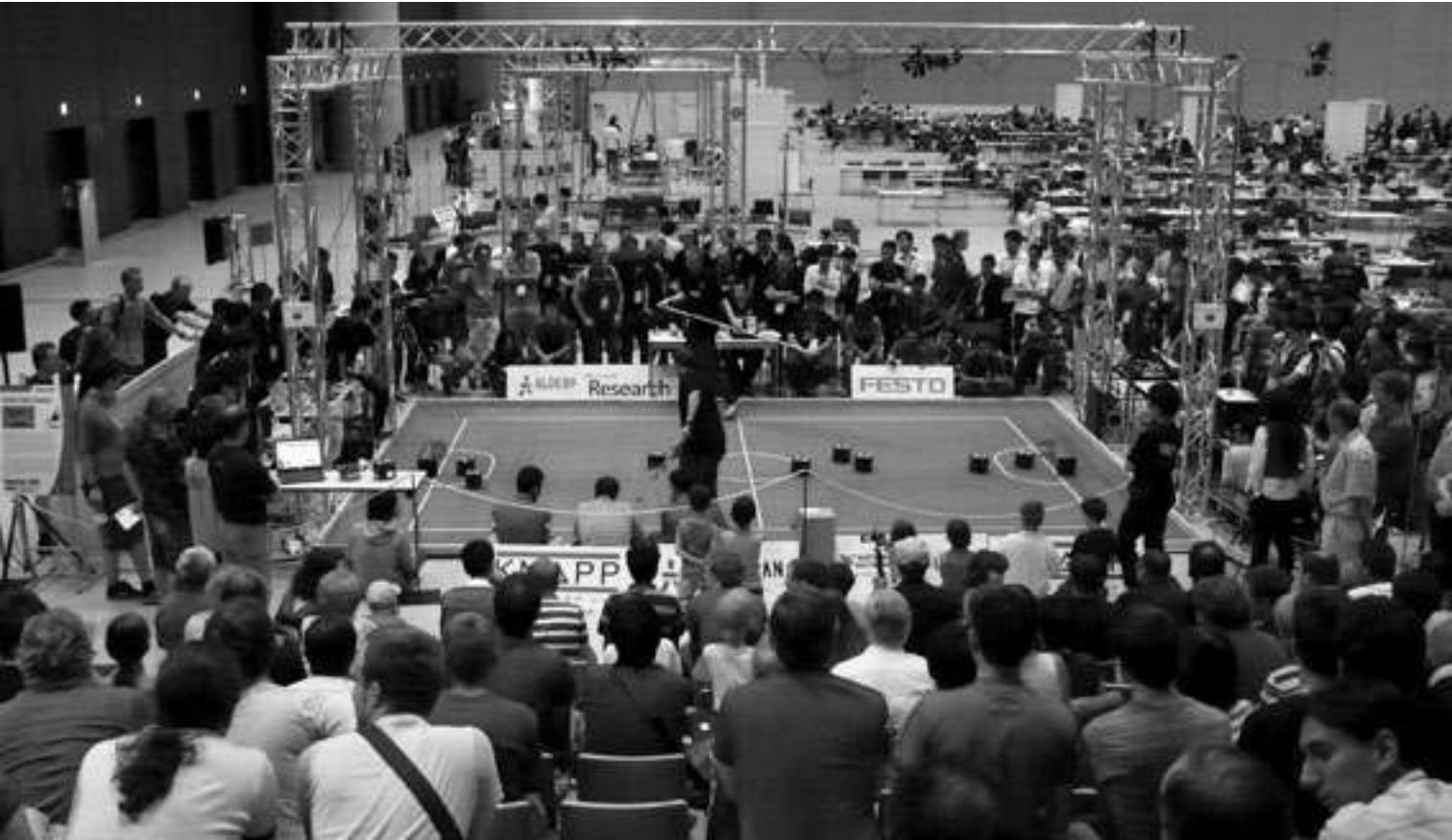
Fig. 2 Vue générale d'un terrain de jeu de la Small Size League , RoboCup 2009, Graz.

chaque équipe, où elles sont analysées et traitées, afin que les commandes soient envoyées de manière automatique vers les machines, par le biais de transmetteurs sans fil.