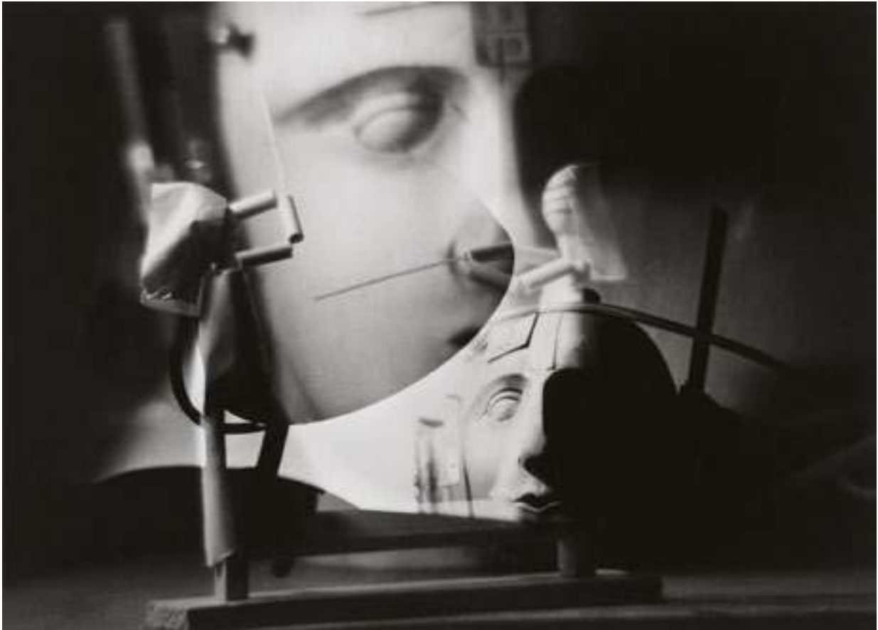
Fig. 3 Raoul Hausman, Jeux mécaniques , Limoges, 1957, surimpression éprouve gélatino-argentique (21,4 x 29, 8 cm)

« On peut élaborer des techniques pour s'adapter, voire apprendre la stratégie adverse, ce que j'ai exploré vers la fin. On essayait d'apprendre les stratégies adverses. Sinon, pour le contrôle de notre propre stratégie de jeu, on essayait de définir, avec cette vue globale, les rôles essentiels de chaque agent. S'il devait défendre, attaquer, faire une passe, et après dans la réalisation propre de chaque action pour chaque individu, on avait plutôt un calcul local et on retombait dans des modèles plus réactifs à base de champs, ou qui pouvaient être bio-inspirés. [...] On avait quand même déjà remarqué dans les premières compétitions que les équipes avaient des comportements efficaces, mais assez stéréotypés ; du type : "on attaque, on frappe toujours la balle par les mêmes couloirs, les mêmes angles, les mêmes zones". On essayait d'apprendre les comportements les plus répétitifs au niveau de la position des robots. Typiquement là où ils frappent la balle pour frapper au but, les couloirs qu'ils utilisent pour faire ce mouvement-là, et d'arriver sur le temps d'une mi-temps, à dégager les lieux de l'espace où ils déclenchent leurs tirs, par exemple. Et l'idée, c'était qu'à la deuxième mi-temps, on positionnait nos robots de défense exactement au milieu des zones qu'ils utilisent pour frapper, pour voir si ça les gênait beaucoup ou s'ils étaient capables de contourner et de s'adapter eux-mêmes. »