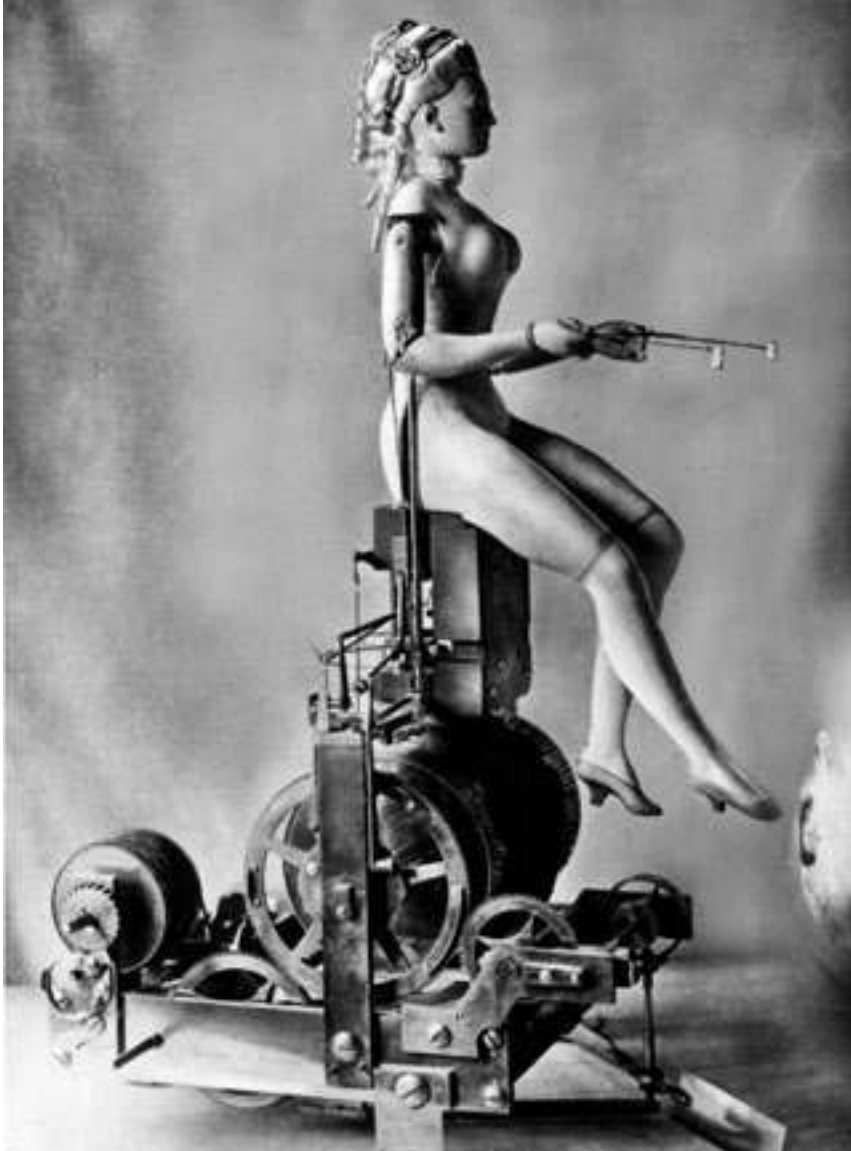
Fig. 6 Joueuse de clavecin. Automate appartenant à Marie-Antoinette, poupée mécanique. vers 1930 © BPK, Berlin, Dist. Rmn/Image BPK.

fonctions élémentaires qui témoigneraient, mieux que tout discours, de la mécanique du vivant. Cette prééminence de la notion de mécanique dans l'indistincte fonctionnalité du vivant, son extraction sous la forme de modèles, son implantation dans l'inertie de la matière, puis l'effet de vie que cette dernière semble, en retour, faire naître au sein du public, par le biais du mouvement, mais également des tentatives maladroites et des erreurs, participent ainsi d'une relation cyclique qui trouve d'étonnantes résonances avec l'activité symbolique (Sperber 2008 ; Vidal 2007). Ces relations métamorphosent la fonction en substrat à partir duquel peut se fonder l'image d'un corps-machine, obligé de passer sans cesse à l'état d'objet pour mieux être envisagé en tant qu'humain, et à l'inverse, de revenir vers la vie pour mieux être envisagé en tant que machine. Tel serait finalement le jeu contenu dans cette imitation ludique d'un jeu. À condition, toutefois, que ce jeu-ci en soit encore un.