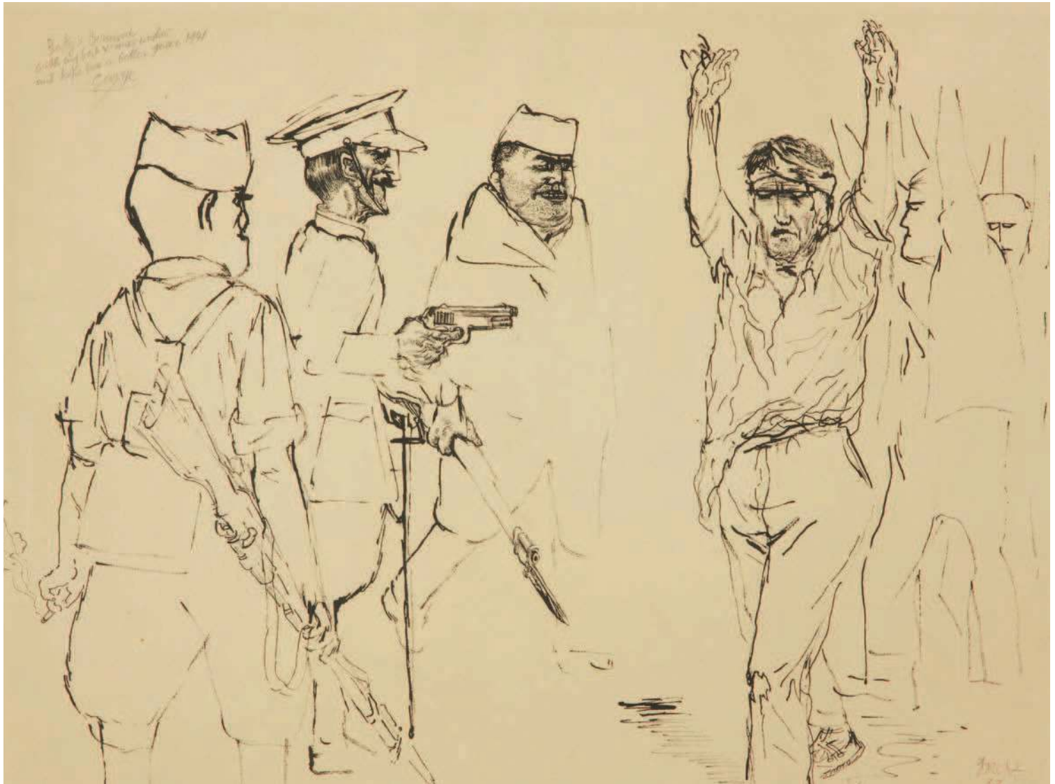
Fig. 1 George Grosz, Espagne , 1937, Museo nacional Centro de Arte Reina Sofia, Madrid © ADAGP, Paris 2011.