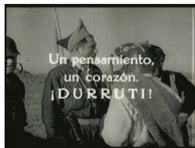
Fig. 3 Photogrammes d'un film sur Buenaventura Durruti, DR.