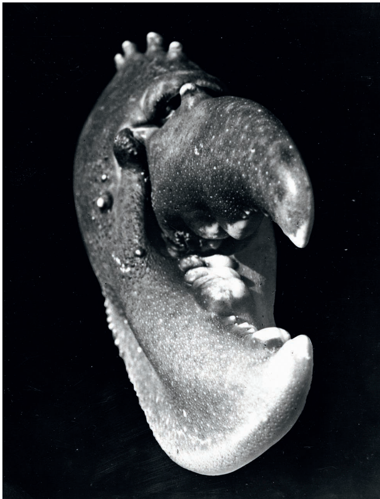
Fig. 4 Jean Painlevé, Pince de homard , c. 1929