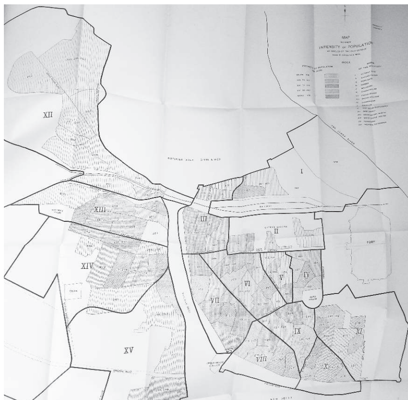
Figure 1. Densité de population à Dehli d'après le recensement de 1931