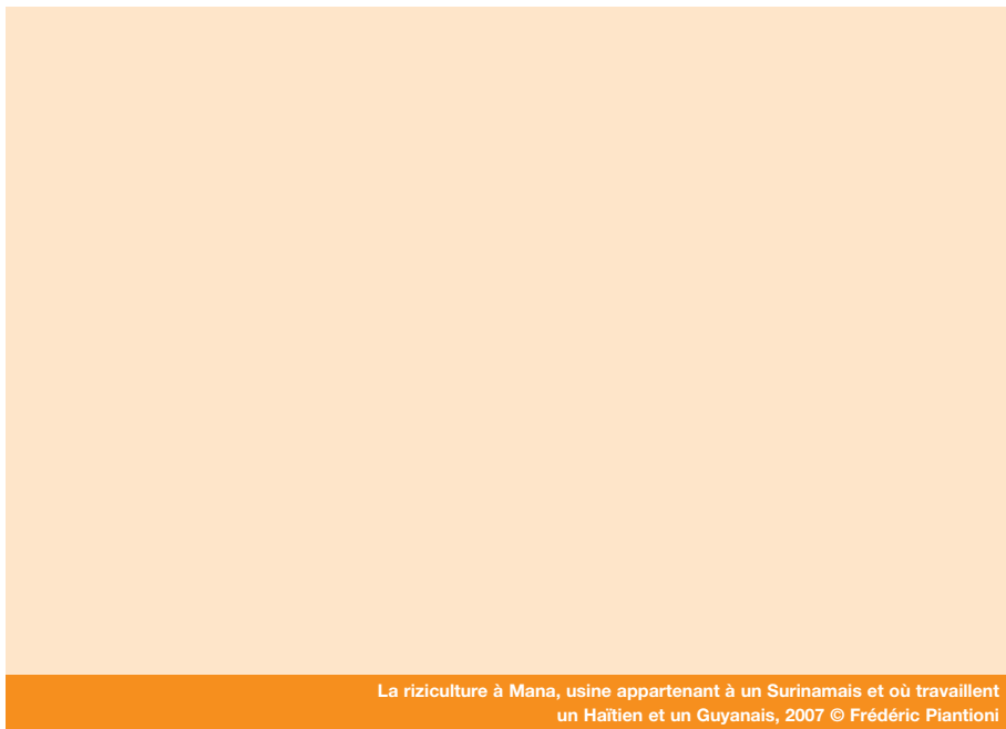
La riziculture à Mana, usine appartenant à un Surinamais et où travaillent un Haïtien et un Guyanais, 2007

Guyane y sont concentrés. Enfin, les Brésiliens sont majoritairement présents dans l'île de Cayenne, qui regroupe 51,7 % d'entre eux, bien qu'ils ne représentent que 19,4 % de la population étrangère, soit 4,9 % de la population totale.