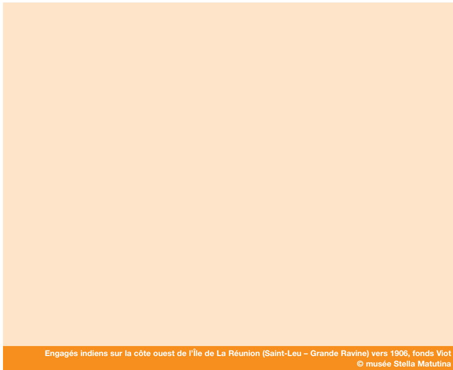
Engagés indiens sur la côte ouest de l'île de La Réunion (Saint-Leu – Grande Ravine) vers 1906

tion dans les colonies françaises proposés par le ministère (8) . Il s'agit alors de proposer un bilan démographique de la colonie dans la perspective de l'application des premières lois sociales décidées dans la métropole, notamment de la loi sur les retraites ouvrières et paysannes, ainsi que celle relative à l'assistance obligatoire aux vieillards, aux infirmes et aux incurables : "Les tableaux statistiques de la Population sont imparfaitement adaptés à la population d'une vieille colonie comme La Réunion. Il a donc fallu élaborer [...] des tableaux nouveaux. C'est ainsi qu'à la distinction fondamentale entre la population européenne, indigène et métis a été substituée nécessairement une classification comprenant, comme dans la Métropole, deux catégories (population française et population étrangère), auxquelles nous nous sommes efforcés de joindre, chaque fois que cela nous a été possible, une troisième catégorie comprenant les travailleurs immigrants (sujets français ou sujets étrangers), qui ont un statut spécial."