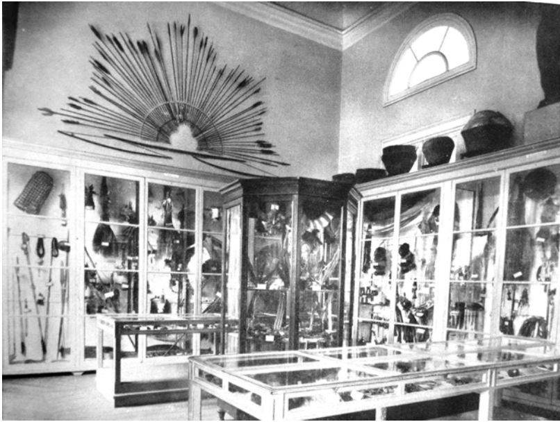
Figura 3. Etnografia Brasileira (Sala B-12) (fonte: Guia da Secção Histórica do Museu Paulista ).