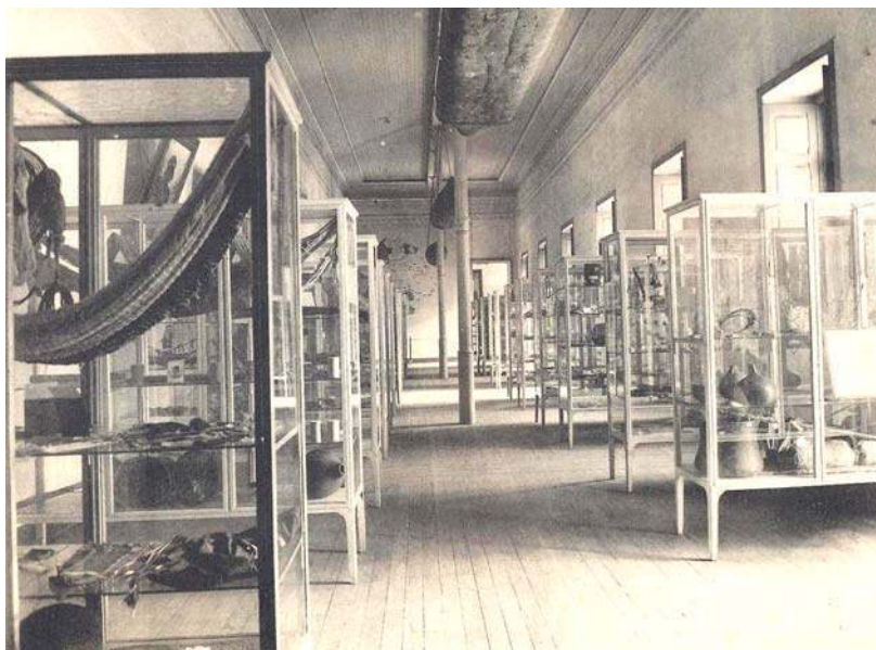
Figura 5. Sala Castelnau, Etnografia do Brasil. A imagem da sala dá uma mostra da visão interna do edifício nesse momento.

Pelos critérios utilizados por Roquette-Pinto na reformulação da sala Etnografia Brasileira, do Museu Paulista e por sua aproximação com as teorias de Bastian e Ratzel é bastante provável que ele tenha dado prosseguimento ao arranjo das peças etnográficas do Museu Nacional conforme a distribuição geográfica das populações indígenas, associando-a aos aspectos linguísticos, ao invés das bacias hidrográficas proposta por Domingos de Carvalho. Inaugurava-se assim no Museu Nacional uma nova relação entre antropologia e discursos expositivos.