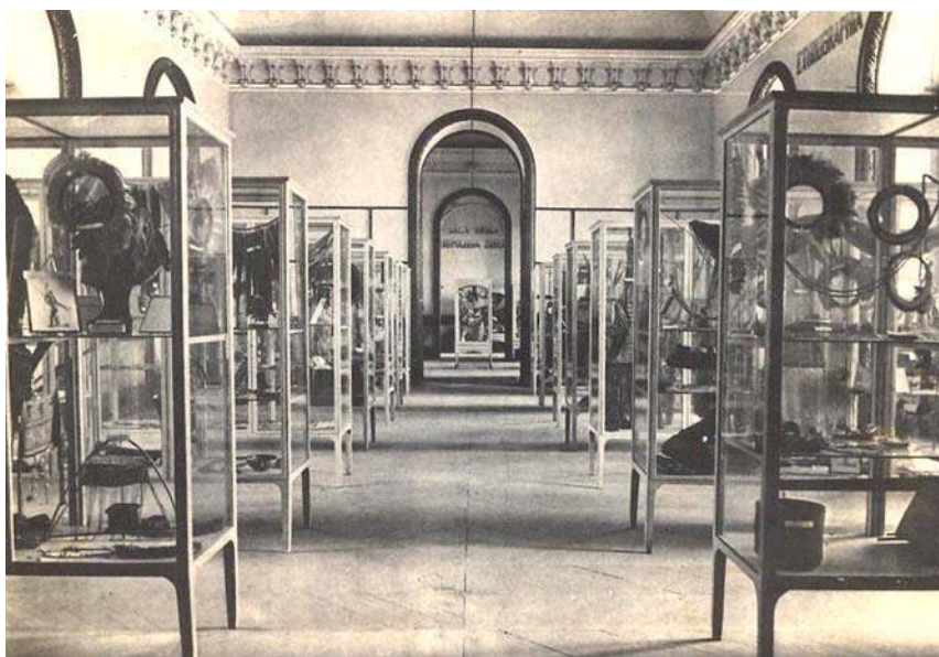
Figura 2. Vista da Sala Gabriel Soares, ao fundo Sala Broca.