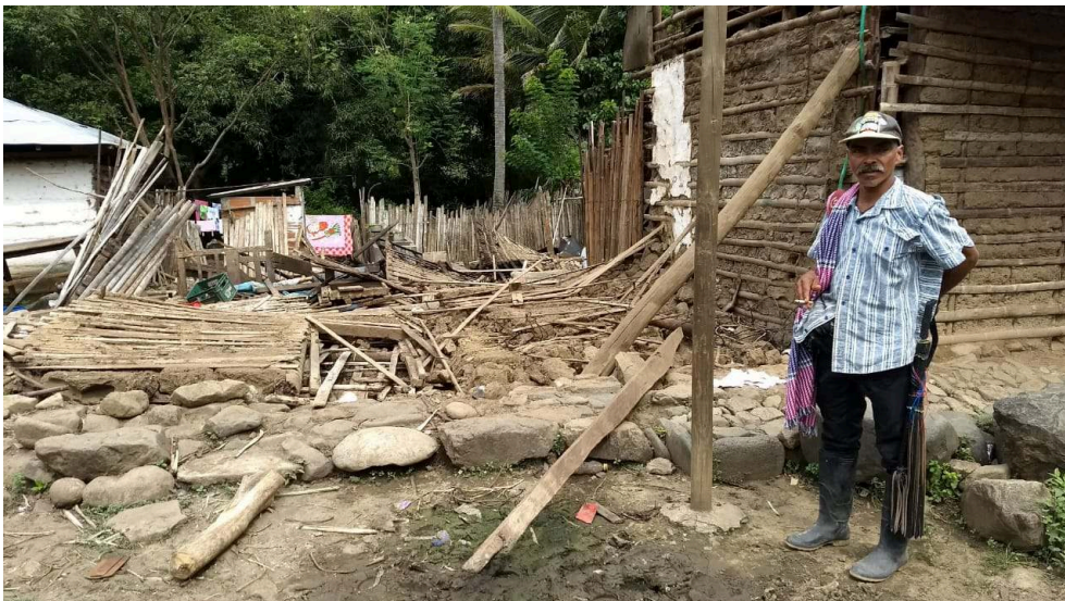
Imagen 2: Municipio afectado después de la inundación de Hidroituango en 2018.