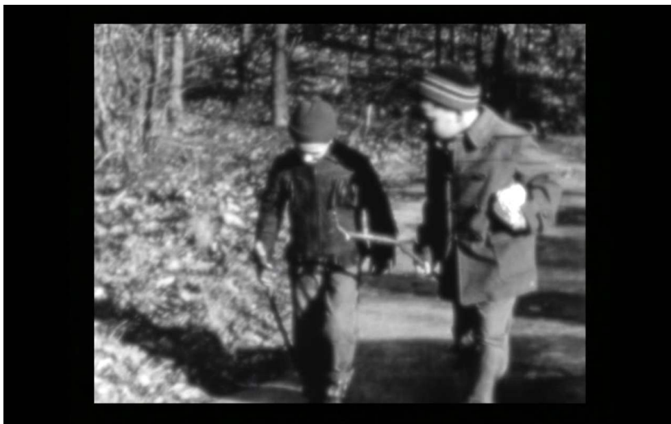
( Reminiscences of a Journey to Lithuania , 00:25)