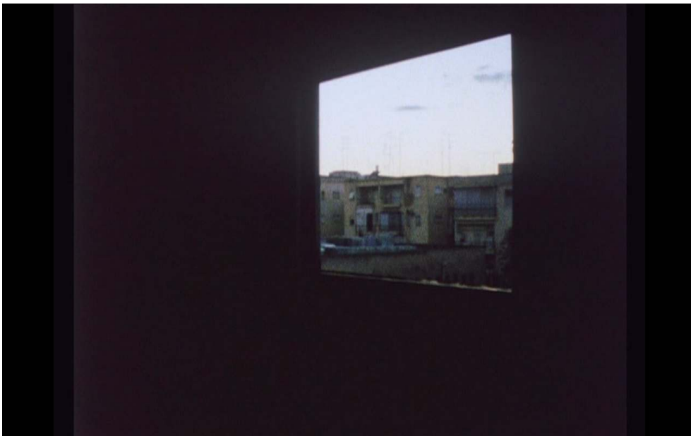
Figure 2. Le premier plan de Perlov

« indépendamment, en dehors du système des studios ou de l'industrie de films commerciaux, en utilisant des modes de production interstitiels ou collectifs pour critiquer ces entités » (2001 : 10). Dans le cas du journal filmé, cette extériorité engendre le passage hors du studio et vers des lieux de tournage à la fois intimes et anonymes : la maison et le monde. Ces deux espaces sont reliés entre eux par la fenêtre, ce lieu interstitiel évoquant la position même de l'étranger à jamais situé entre le pays natal et le pays d'adoption. Dans Diary , le plan inaugural capté par Perlov montre, précisément, une fenêtre. Révélant un premier regard qu'il pose sur le monde, cette image laisse entrevoir le mouvement même du journal filmé : celui du « je » vers le monde, les choses et les êtres.