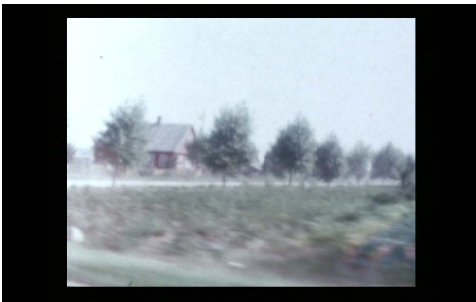
Figure 4. Le retour en Lituanie

( Reminiscences of a Journey to Lithuania , 10:45)