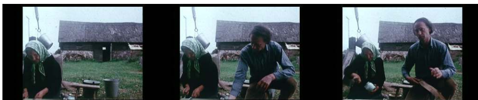
( Reminiscences of a Journey to Lithuania , 56:45-56:59)