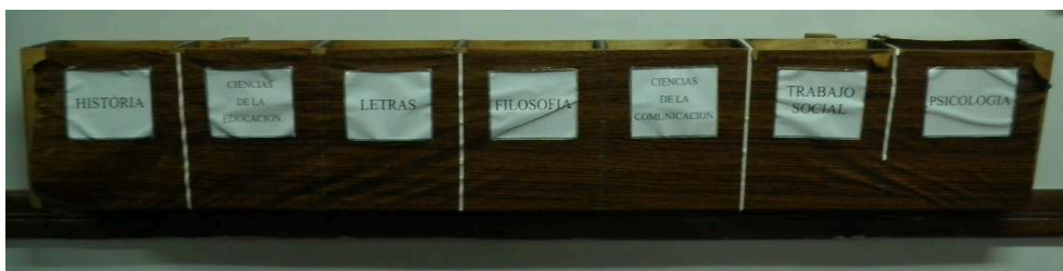
Caixas de correio dos sete departamentos na faculdade de Filosofia da Universidade Nacional de Assunção

seminários, conventos e colégios dominicanos, agostinianos ou jesuítas 12 . Algumas universidades são ditas mayores, oficiales y generales, com rendas da Real Hacienda, com muitas cadeiras e privilégios; outras são ditas particulares e não têm a mesma autoridade para emitir diplomas. Elas são organizadas em quatro facultades mayores (grandes faculdades): teologia, direito canônico, direito, medicina, junto com uma faculdade menor de "arte e filosofia". Um colégio franciscano, Santa Cruz de Tlatelolco, foi criado muito cedo para as elites indígenas do México (1533): durante cinquenta anos, o ensino do latim, mas também o desenvolvimento de um alfabeto latino para o Nahuatl, deram à luz vários trabalhos científicos importantes com base nos conhecimentos médicos e históricos nahua. As primeiras gerações de nativos formados na escola tinham responsabilidades significativas, tanto na sua própria universidade como em outras instituições coloniais, mas depois esse modelo definiu. Este modelo difusionista, que se fundamenta na importação do modelo medieval espanhol, é bastante simplista, e no entanto favorece um processo importante: a fundação rápida e sustentável de mais de vinte e cinco universidades em todo o território da América espanhola, enquanto a coroa Portuguesa, no mesmo período, permitiu apenas a abertura de colégios e não de universidades. Até 1808, data em que a família real instalou-se no Brasil, não havia no solo dessa colônia nenhuma universidade.