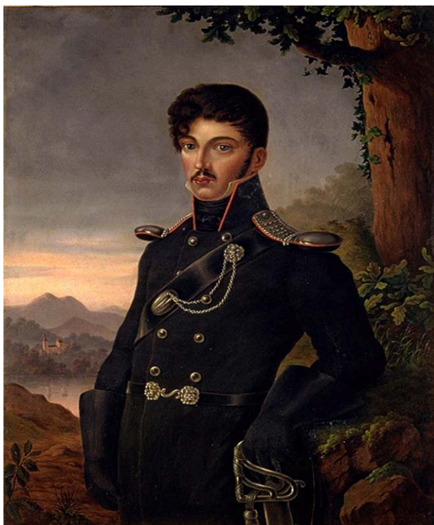
Figure 2. – Theodor Körner (1791-1813).