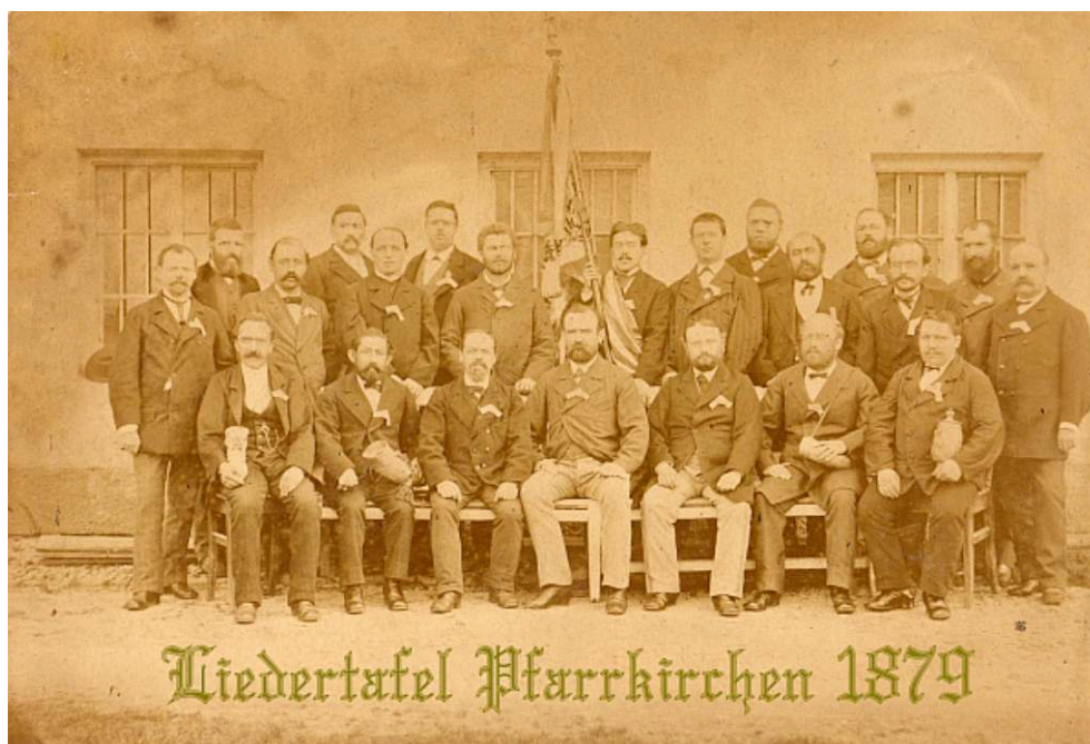
Figure 3. – Une Liedertafel .