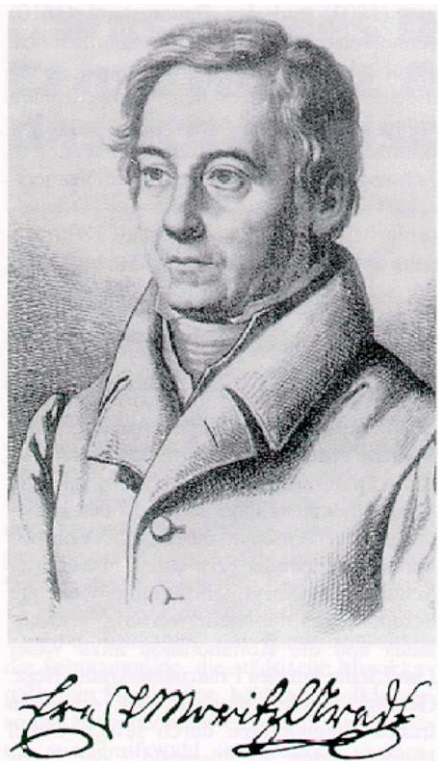
Figure 1. – Ernst Moritz Arndt (1769-1860).

s'exprime à travers une vague de Lieder patriotiques. Nous y trouvons le schéma de production habituel : le Lied est d'abord un poème, publié en tant que tel, sans musique, mais dont le nom même appelle la mise en musique. Le poète, lorsqu'il écrit, espère que sa poésie vivra chantée par le peuple. Deux poètes emblématiques de cette vague, Ernst Moritz Arndt (1769-1860) et Theodor Körner (1791-1813), verront ce souhait particulièrement exaucé.