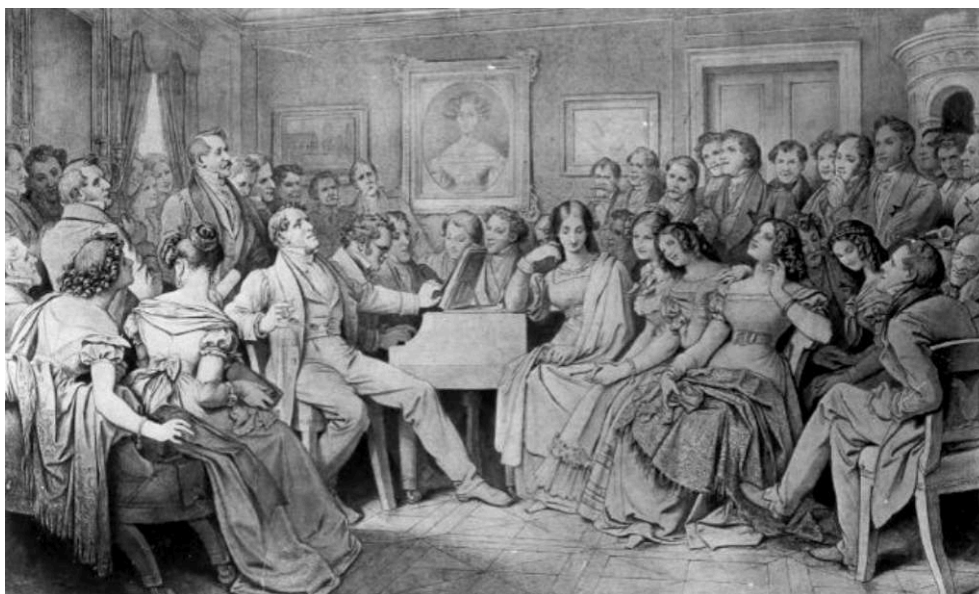
Moritz von Schwindt était un ami de Schubert et a dessiné la scène, de mémoire, en 1868.