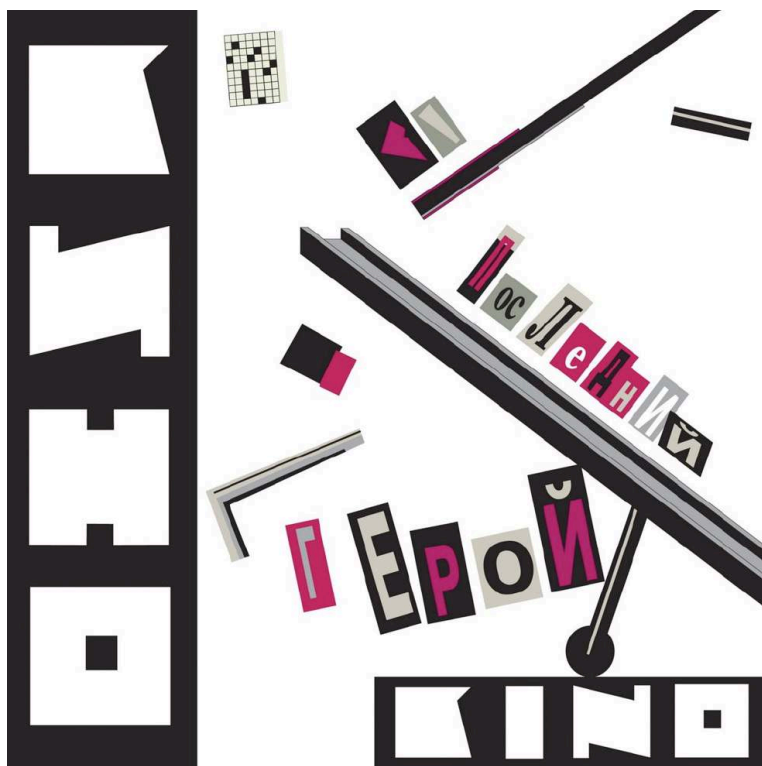
Figure 2. – Pochette de l'album Poslednij geroj (Le dernier des héros) du groupe DDT (1989).