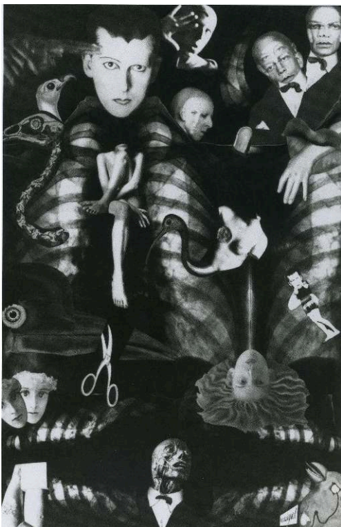
Claude Cahun et Marcel Moore, Aveux non avenues , Planche VIII, photomontage, 1929-1930. Claude Cahun, catalogue de l'exposition , Hazan/Jeu de Paume, Paris, 2011, p. 50.