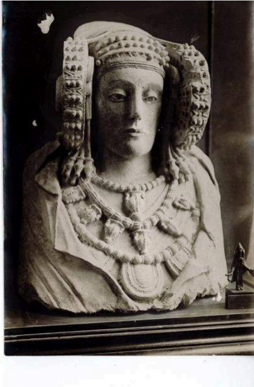
Dame d'Elche. Photographie prise en 1906 au Louvre.