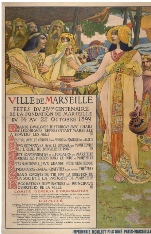
Affiche de David Dellepiane pour les fêtes du 25 ème anniversaire de la fondation de Marseille, 1899.