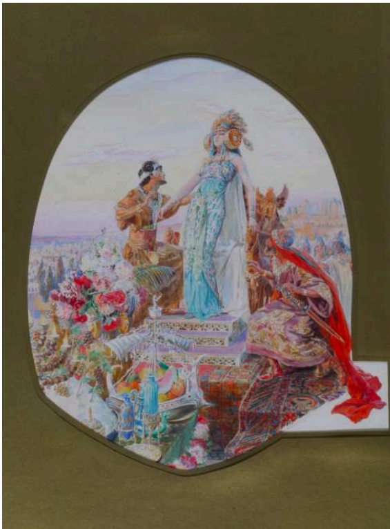
Georges-Antoine Rochegrosse, illustration de l'édition de 1900 de Salammbô , Gustave Flaubert, Ferroud Editeur, coll. particulière.