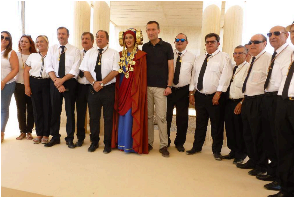
La « Dame vivante », le maire d'Elche et le comité directeur de la Real Orden de la Dama de Elche lors de la commémoration de la découverte du buste le 4 août 2018.