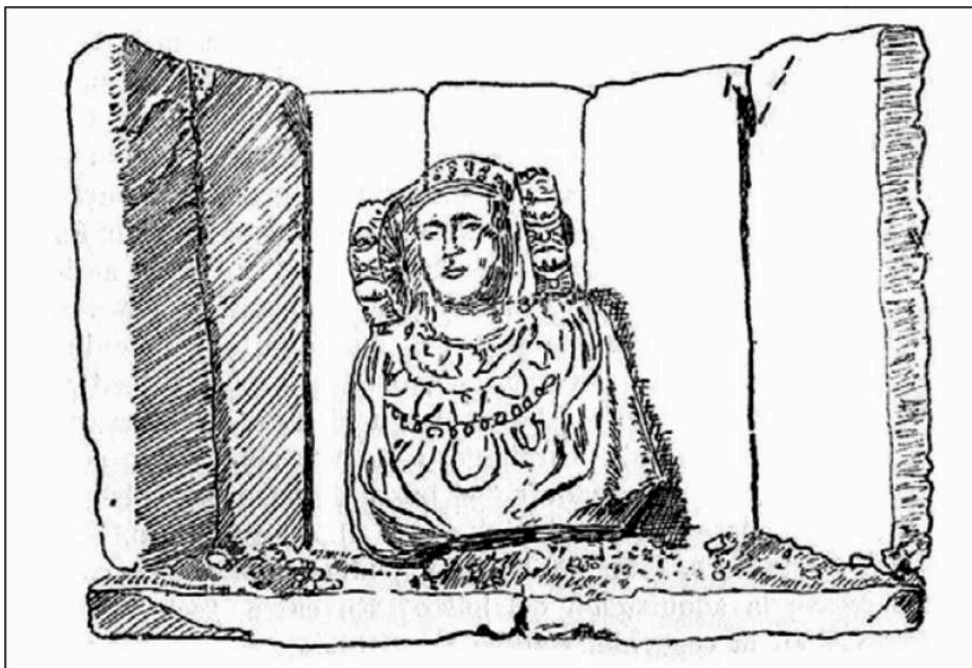
Dessin d'Alejandro Ramos Folqués publié dans La Dama de Elche. Nuevas aportaciones a su estudio , Madrid, Gráficas Uguinos, 1945, p. 10.