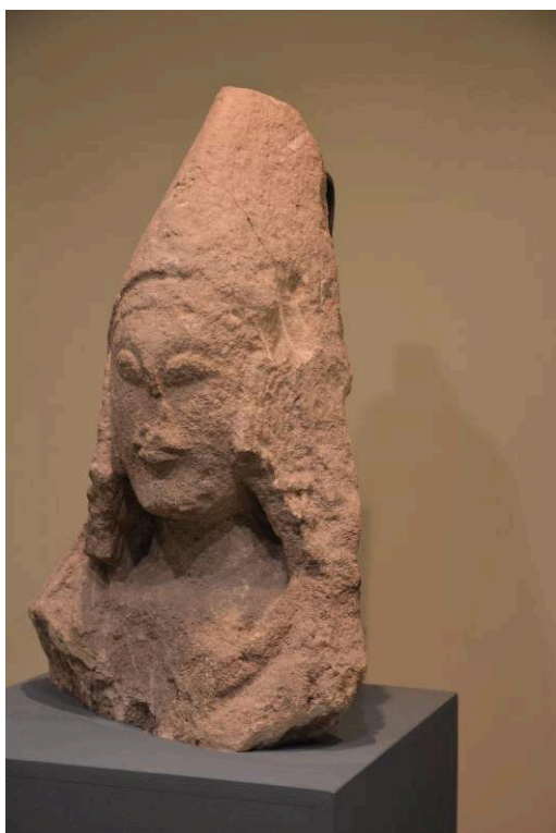
Cerro de los Santos (Albacete): dame portant une mitre, Musée d'Albacete.