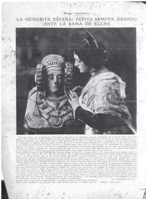
« La Miss Espagne, Pepita Samper, priant devant la Dame d'Elche », Journal ABC, 23 juin 1929, p. 19.