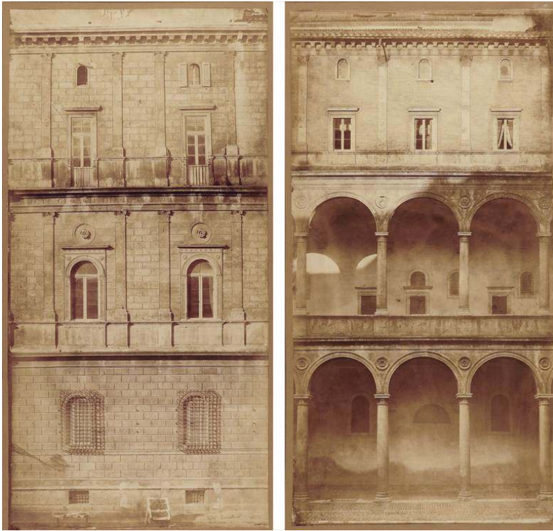
Fig. 6 : Gustave Chauffourier, Palais de la Chancellerie à Rome , montage de trois épreuves albuminées d'après négatif verre sur un même support formant une élévation complète de deux travées de la façade extérieure et montage de trois épreuves albuminées d'après négatif verre sur un même support formant une élévation complète de trois travées de la façade sur cour, New York, collection particulière.