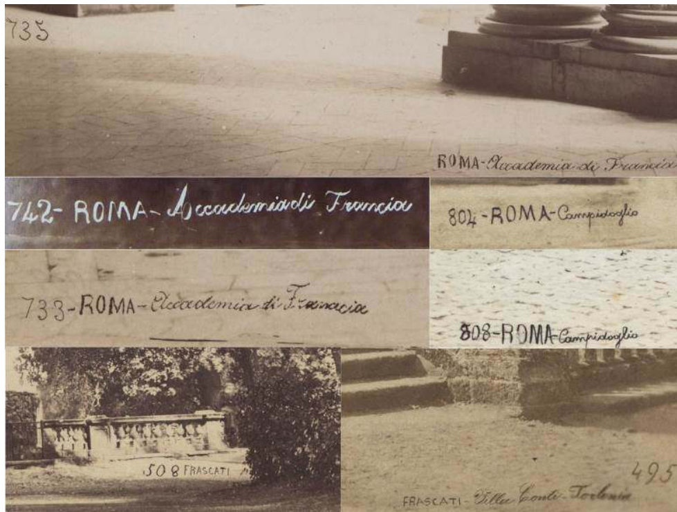
Fig. 4 : Comparaison de différentes signatures de Chauffourier en clair ou en sombre dans le négatif, qui découlent de différentes techniques : gravure dans la couche sensible du négatif, écriture en sombre sur le négatif ou contretypage d'une épreuve légendée.

technique dénote la constitution d'un catalogue à partir d'éléments de différentes origines, produits à des époques variées : des plaques provenant sans doute de l'activité de plusieurs photographes et des lots d'épreuves sans le négatif correspondant, qu'il fallait contretyper pour continuer à les maintenir au catalogue. Les deux auteurs de cet ensemble identifiés jusqu'à présent sont De Bonis et Simelli.