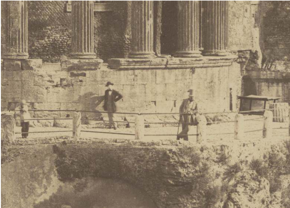
Fig. 1 : Tommaso Cuccioni, Vue verticale du temple de la Sibylle à Tivoli (détail) , tirage albuminé d'après négatif verre, 46 x 33 cm, Paris, collection particulière.