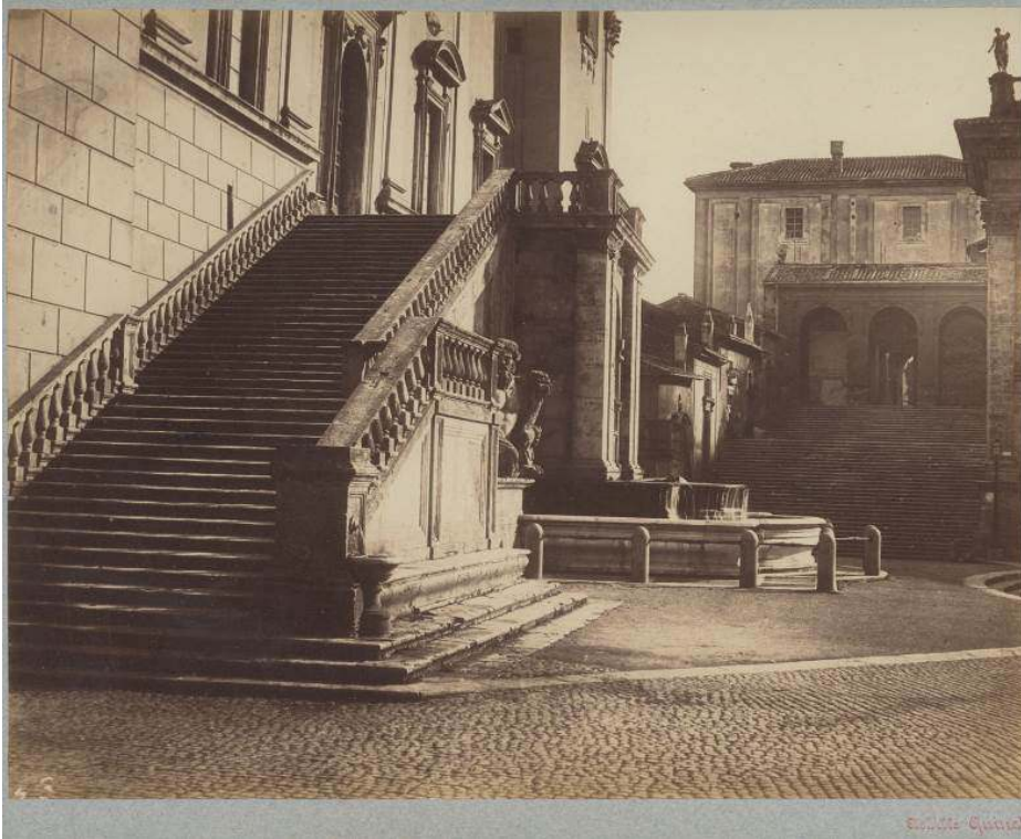
Fig. 3 : Adriano De Bonis, Vue de la place du capitol à Rome , tirage albuminé d'après négatif verre, 19,5 x 24,8 cm, monté sur un carton bleuté portant le cachet rouge d'Achille Quinet, Paris, collection particulière.

des photographes actifs pour John Henry Parker, en lien direct avec Carlo Baldassare Simelli sur lequel nous reviendrons 13 .