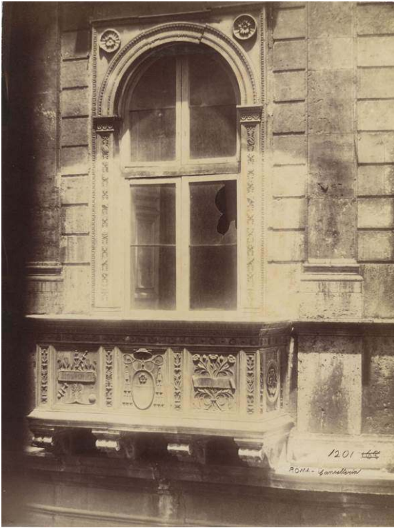
Fig. 5 : Gustave Chauffourier d'après un négatif d'Adriano De Bonis, Vue de la fenêtre d'angle du palais de la Chancellerie à Rome , tirage albuminé d'après négatif verre, 24,6 x 18,6 cm, Paris, collection particulière.