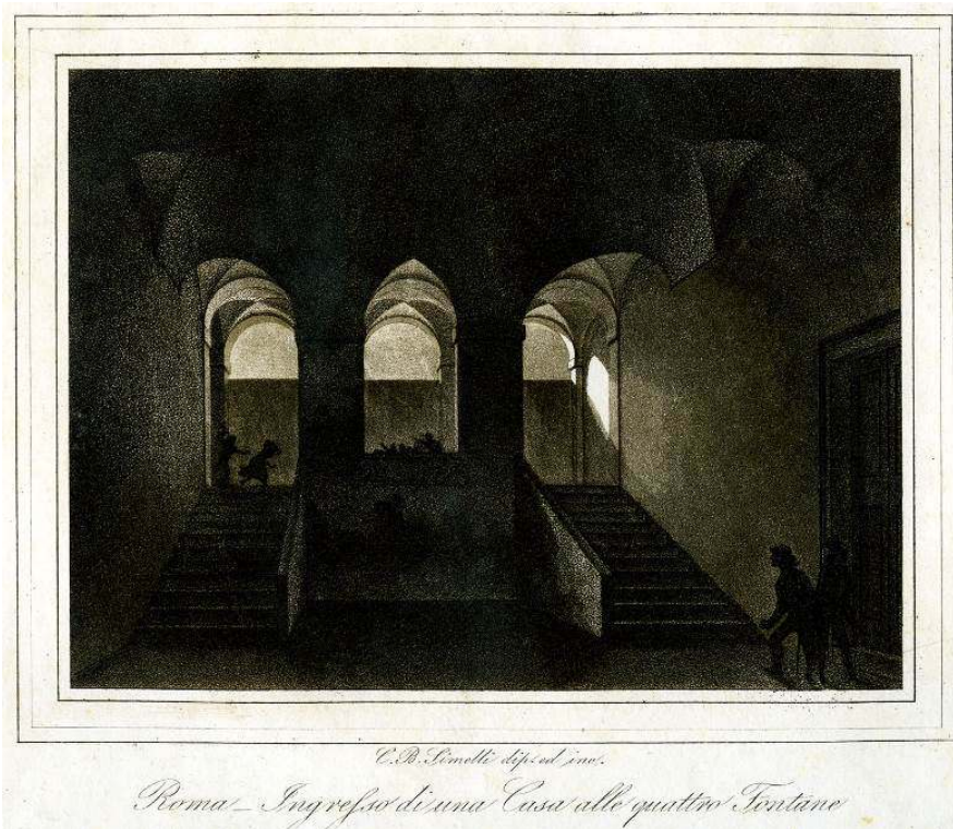
Fig. 7 : Carlo Baldassare Simelli, d'après Percier et Fontaine, Vue du départ de l'escalier du palais Tomati Strada Felice à Rome , aquatinte, Paris, collection particulière.

gravé publié à Paris et qui était fondamental pour la culture des architectes français élèves de l'École des beaux-arts : celui que Percier et Fontaine avaient dédié aux palais de Rome en 1798 et dont la planche 31 représentait le Vestibule d'une maison Strada Felice [ fig. 8].