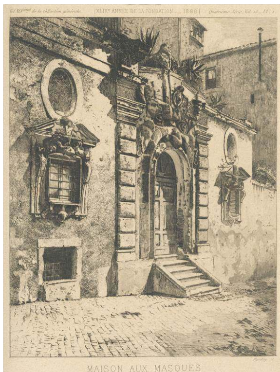
Fig. 2 : Herdey (graveur), Vue du portail du palais Zuchari à Rome , dans César Daly, Revue générale de l'architecture , vol. 45, 1888, pl. 1.