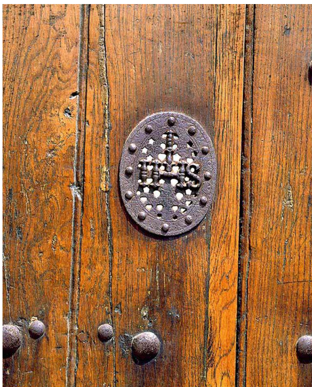
Judas sur une porte de l'aile orientale de la « cour des classes »