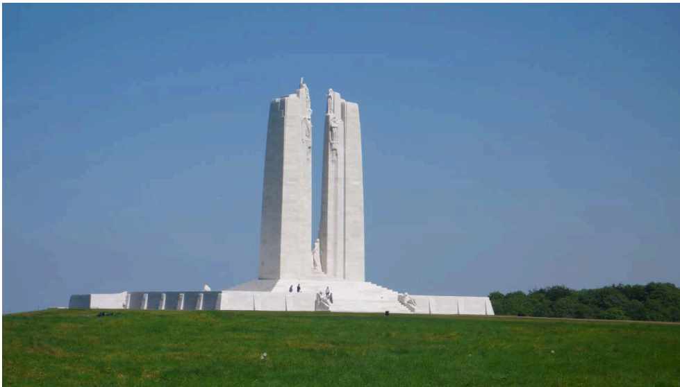
Mémorial de Vimy, à la mémoire des soldats canadiens morts en France pendant la Première Guerre mondiale.