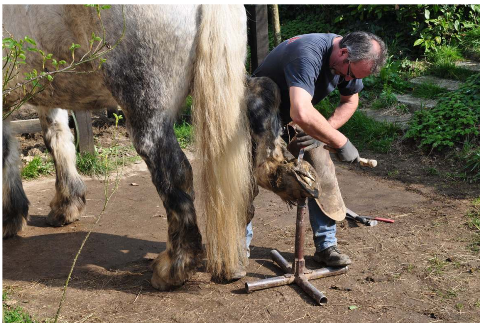
Perche (Orne), maréchal-ferrant.