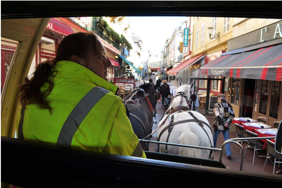
Trouville-sur-Mer (Calvados), employée municipale de la voierie.