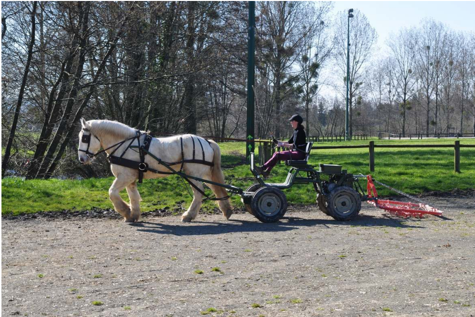
Manche. Normandie Trait, porte-outils Tractozore (entreprise Clémobil) et herse.