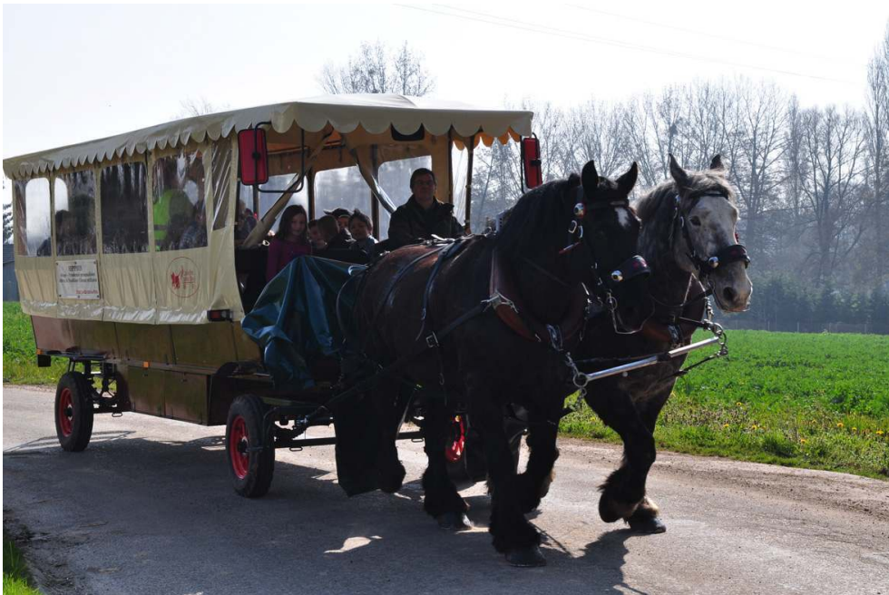
Chaise-Dieu-du-Theil (Eure), ramassage scolaire.