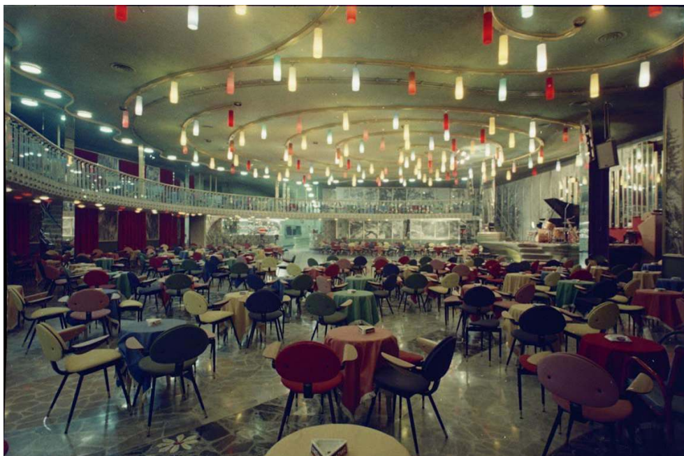
Carlo Mollino, la salle du dancing Lutrario-Le Roi, Turin. Dans « Carlo Mollino. Foto di architetture », Domus , n°950, septembre 2011.