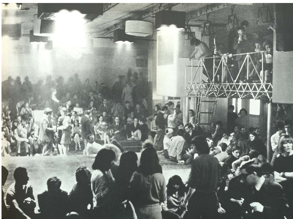
Le Piper Pluriclub à Turin. Dans TRINI, T. « Divertimentifici », Domus , n°458, 1968.