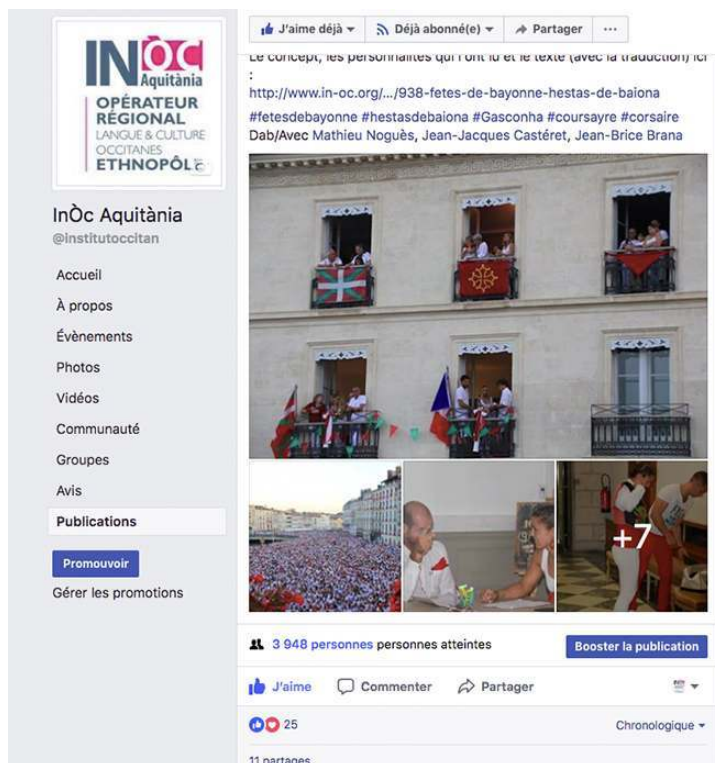
Publication sur la page Facebook de l'InOc Aquitaine à l'occasion de l'ouverture des Fêtes de Bayonne.