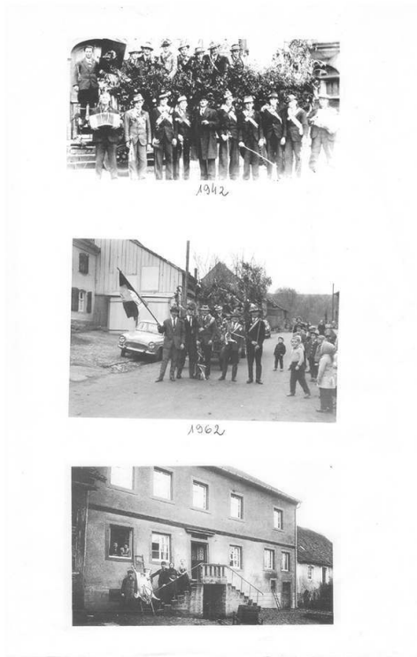
Photocopie de clichés de la Kirb , Delhingen.