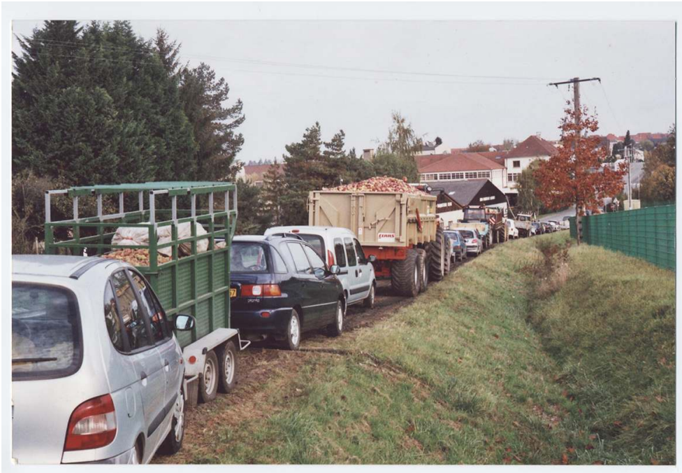
Clichés de livraisons de pommes à Sarre-Union.