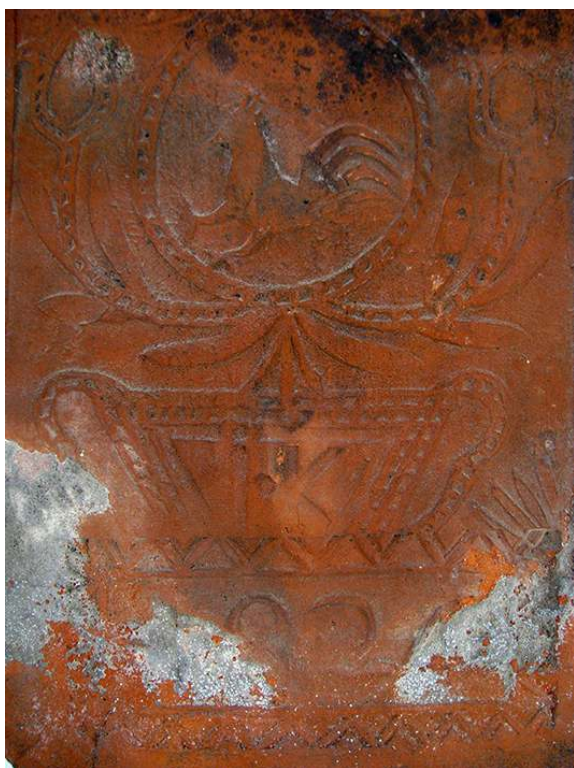
« Les symboles traversent les siècles ». Détail d'une tuile, Ratzwiller.