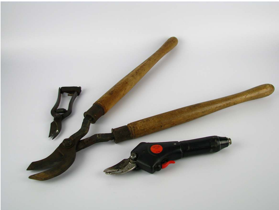
« On ne peut pas seulement avoir des bosses sans aucun arbre pour maintenir une ceinture verte autour du village ». Outils de taille pour les pommiers.

Phot. Lætitia Velten, 2016. © Sycoparc/L. Velten.