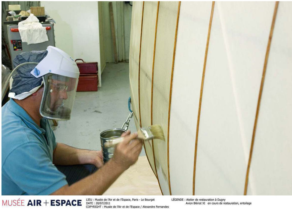
Atelier de restauration du musée de l'Air et de l'Espace, Le Bourget. Entoilage d'une aile de Blériot XI-2 .