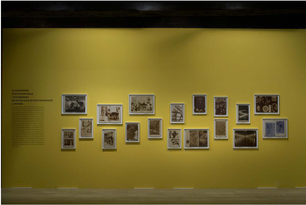
Vue de l'exposition « Regarder VU », 2007.