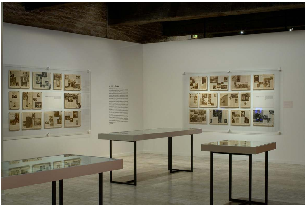
Vue de l'exposition « Regarder VU », 2007.