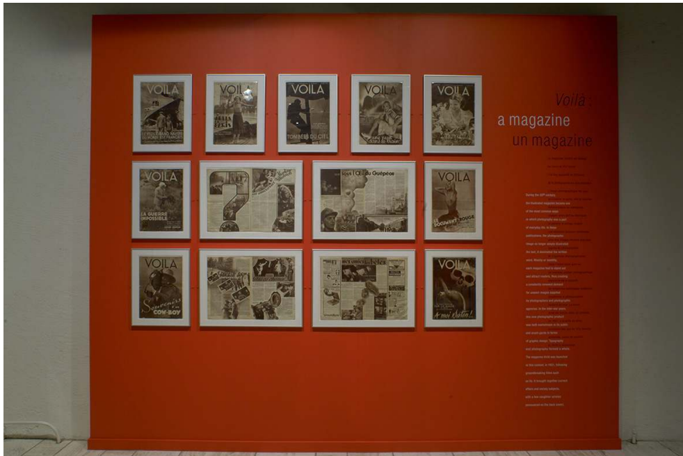
Vue de la salle Durville, cimaise consacrée au magazine Voilà .