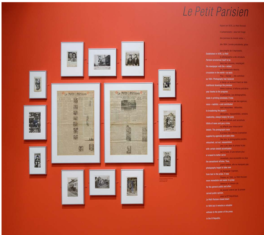
Vue de la salle Durville, cimaise consacrée au journal Le Petit Parisien .