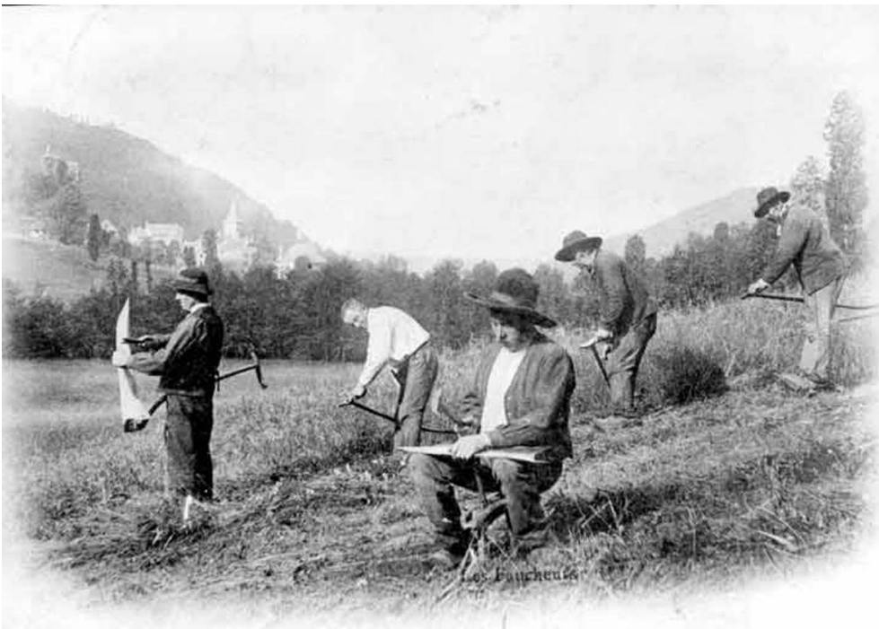
Les faucheurs , photographie par l'abbé Gély, 1899

Repro. Inv. R. Choplain - R. Maston © Inventaire général, ADAGP, 1981