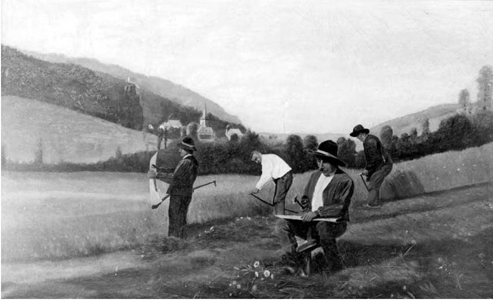
Les faucheurs , Vic-sur-Cère (Cantal), hôtel du Pont et du Parc, salle à manger, peinture par Antoine Cayrol, 1909