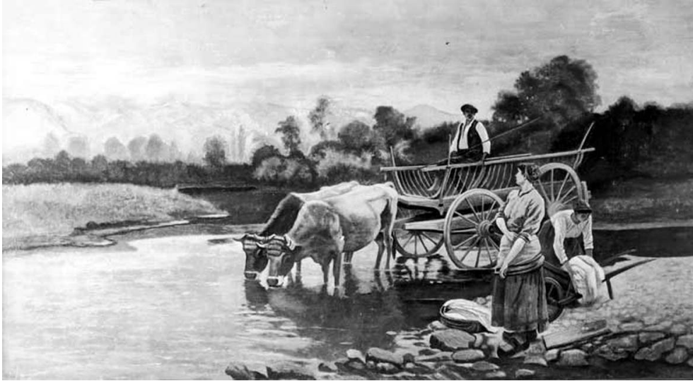
Le gué , Vic-sur-Cère (Cantal), hôtel du Pont et du Parc, salle à manger, peinture par Antoine Cayrol, entre 1909 et 1914