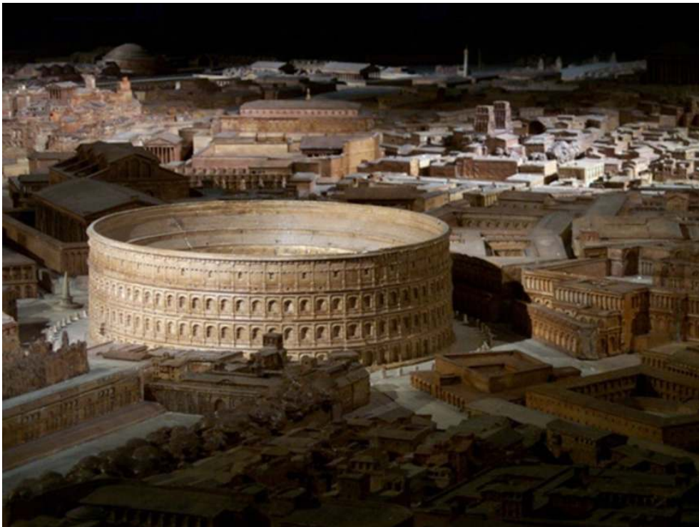
Le Colisée sur la maquette de Paul Bigot. Université de Caen Basse-Normandie, Plan de Rome (France)