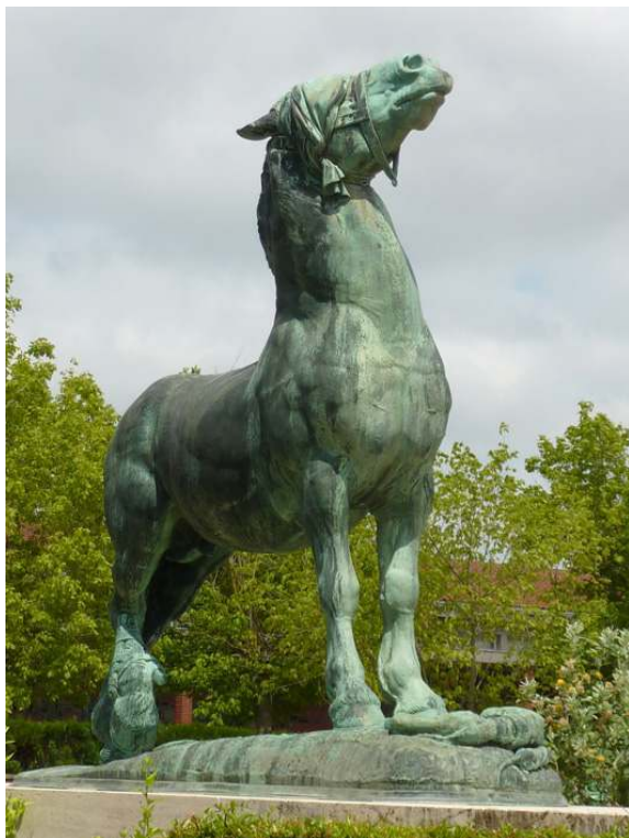
Le condamné de Montfaucon, par Emmanuel Frémiet. Collections de l'ENVT.