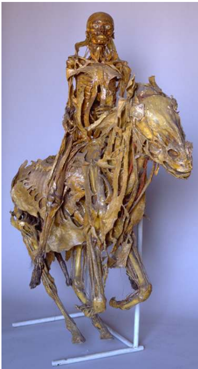
Le cavalier , par Honoré Fragonard (entre 1765 et 1771). Collections du Musée Fragonard.