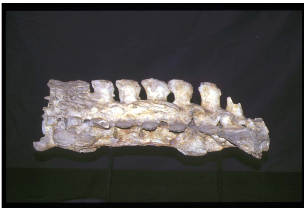
Ankylose de la colonne vertébrale. Collections du Musée Fragonard.