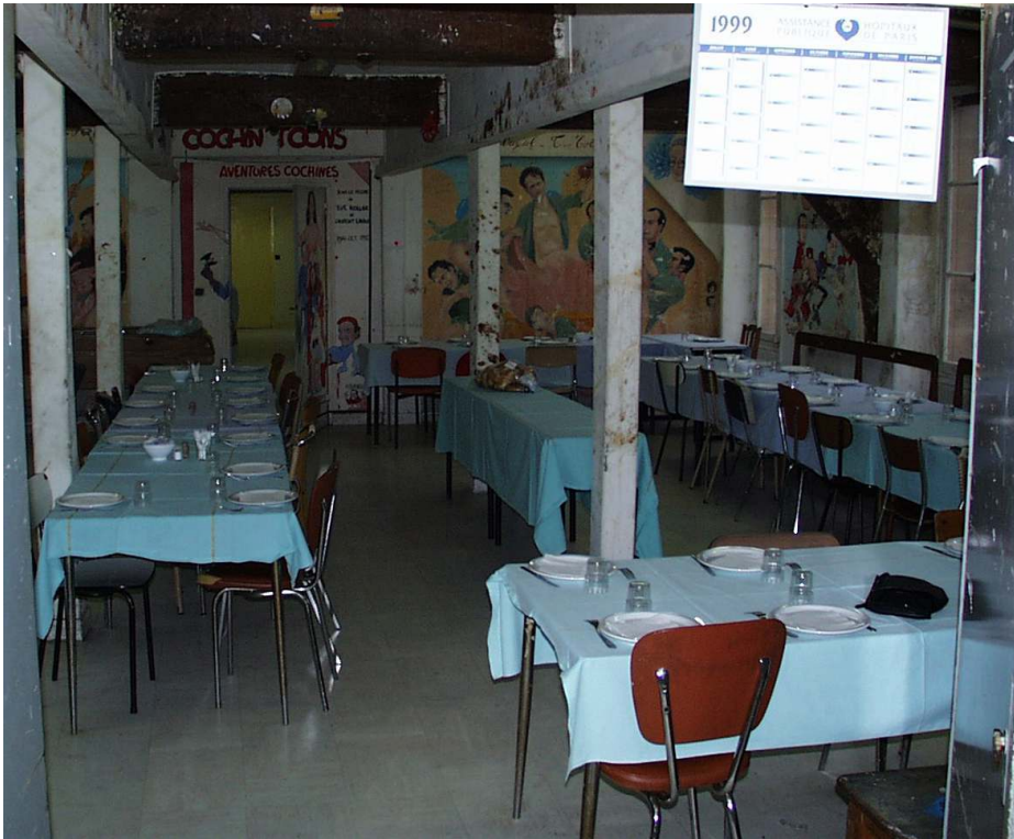
La salle de garde de l'hôpital Cochin en 1999.