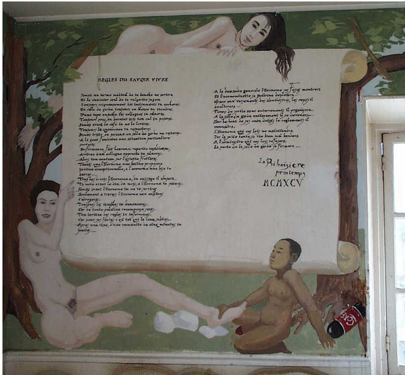
Fresque de la salle de garde de l'hôpital Lariboisière en 1995.