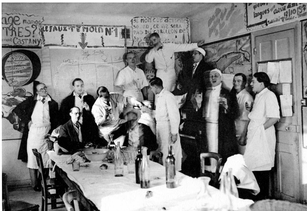
La salle de garde des internes à l'hôpital Bichat (1937-1938).