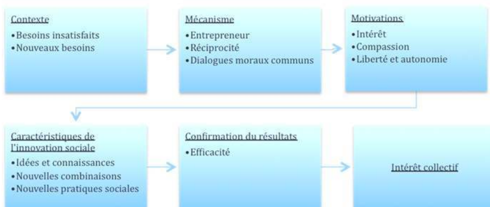
Tableau I Processus d'innovation sociale dans les termes de la théorie du choix rationnel

expliquer plusieurs phénomènes humains, car les agents ne disposent pas de toute l'information disponible pour prendre leur décision, la rationalité est limitée (Boudon 2004). Si cette théorie est riche en explications des motivations individuelles dans l'action, elle est néanmoins faible dans la compréhension générale de l'apport des arrangements sociaux qui sont intégrés à l'action individuelle et auxquels les acteurs se réfèrent lorsqu'ils désirent coopérer afin de changer l'état de la situation. Pour cela, il faudra se tourner vers les théories institutionnalistes. Chez Schumpeter, l'initiative individuelle jouerait un rôle considérable dans le changement sociétal. L'entrepreneur a une énergie supranormale; il recherche le « prestige », et donc agit par rationalité. Toutefois, l'individu ne jouit pas d'une totale liberté d'action, les individus étant aussi les produits des institutions (Dannequin 2004). C'est que nous allons maintenant examiner dans la prochaine section.