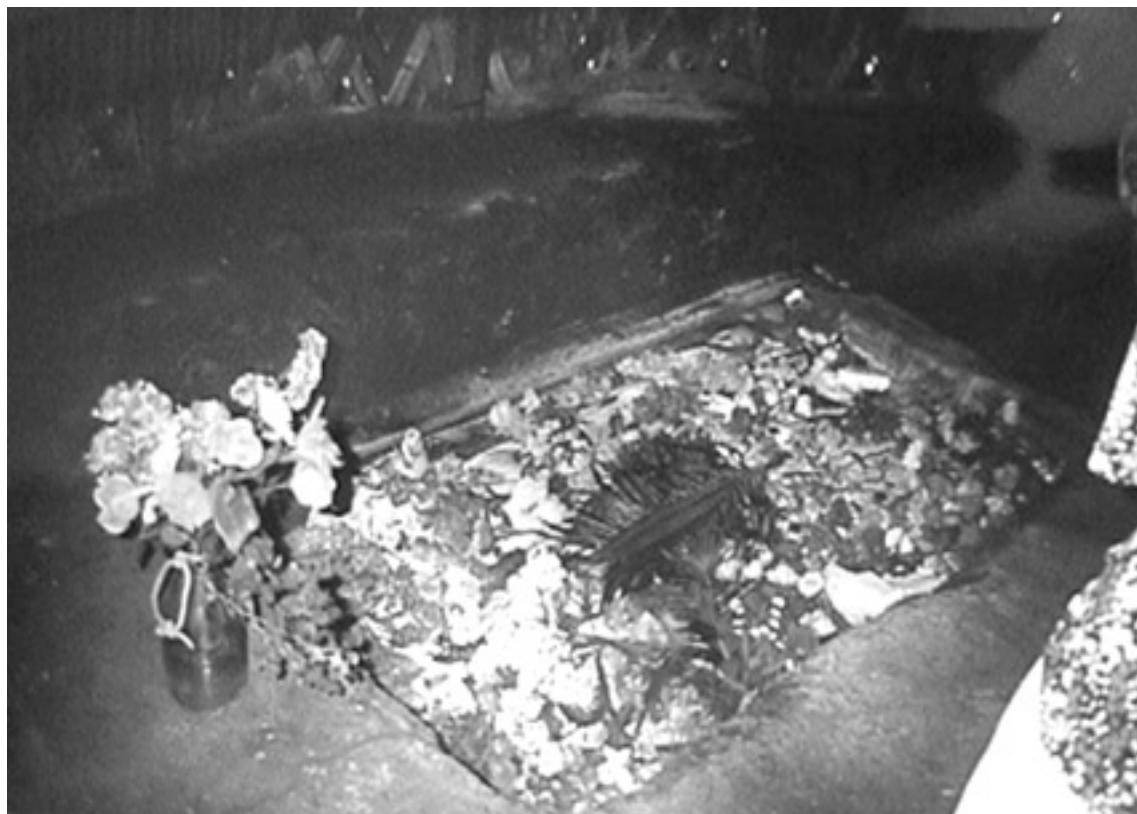
FIG. 6. — Tombe de Jimmy Stevens dans sa case.