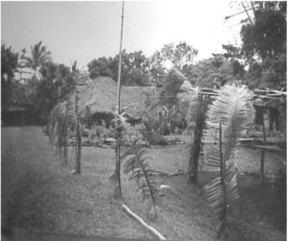
FIG. 5. — Ruines de Radio Vemarana à Vanafo.