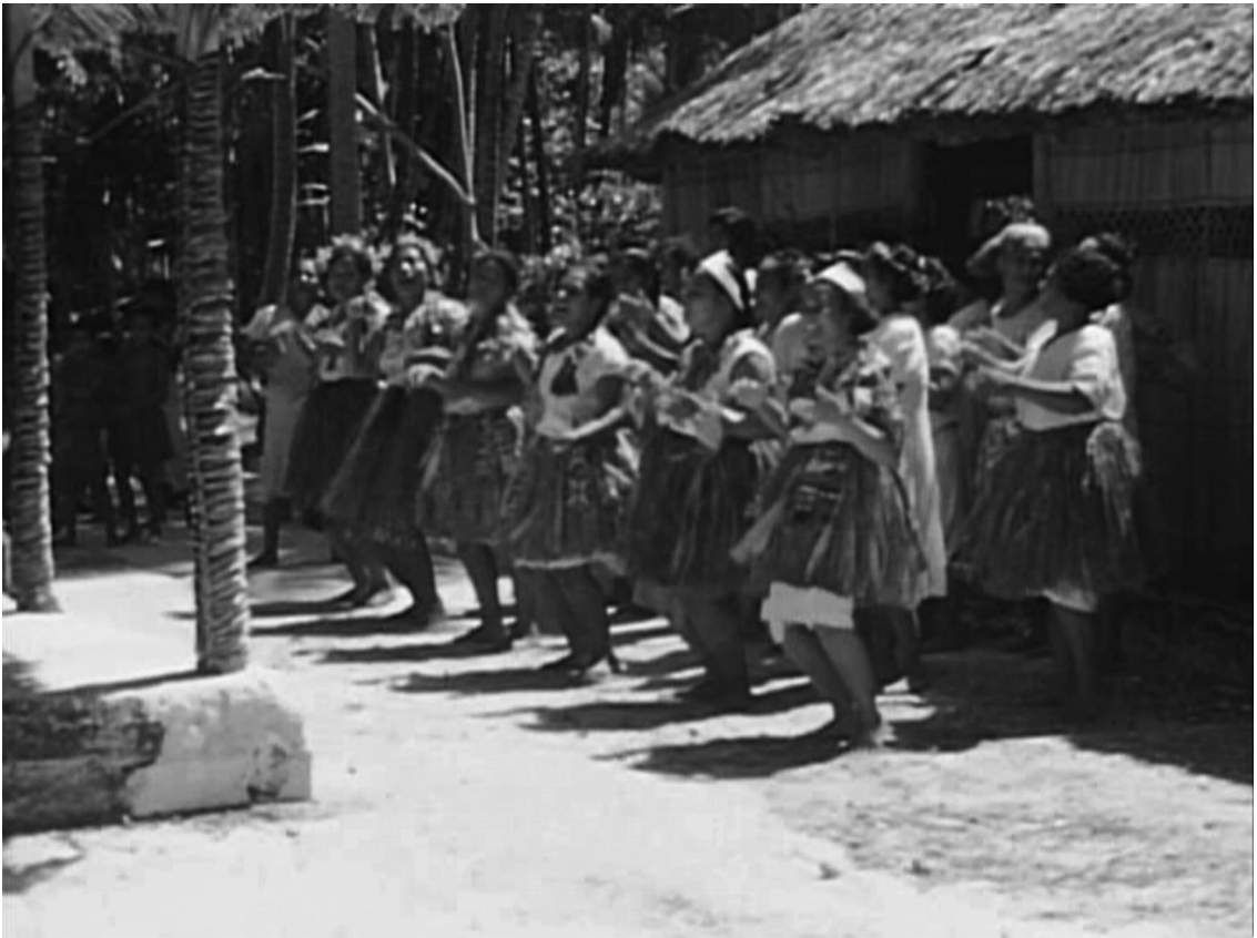
Photo 2. – Danse faka Niutao d'un groupe de jeunes filles de Wallis en 1943 (photo extraite d'un film 16 mm couleur)

Cette photo doit être rapportée à un maholo , occasion festive informelle dans un cadre villageois ou familial, quelque part au sud de l'île (peut-être Gahi). Le genre de danse peut être identifié comme un faka Niutao , genre de danses répétitives exécuté debout par un groupe d'une vingtaine de danseurs et/ou danseuses.