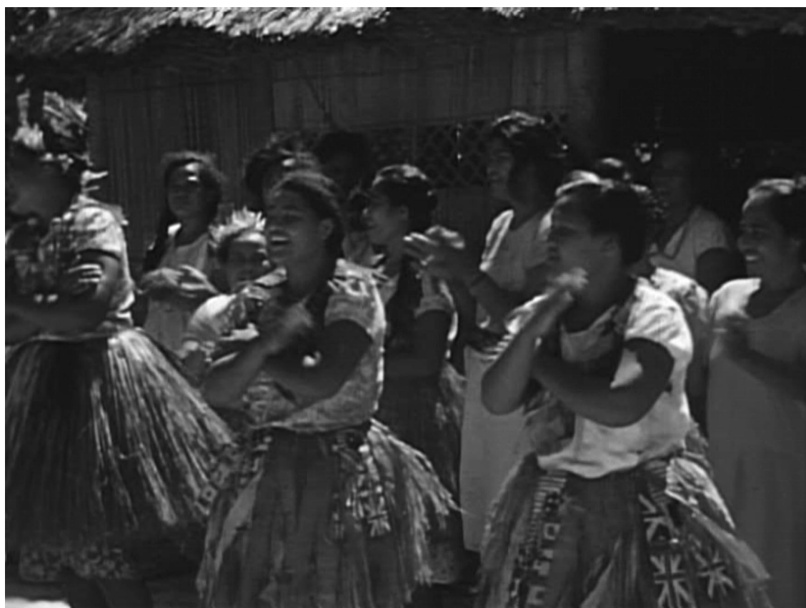
PHOTO 3. – Plan rapproché de danse faka Niutao exécutée par des jeunes filles wallisiennes en 1943 (extrait de film 16 mm couleur)

Les mouvements de mains sont de type vahe, ki mua et ki lalo et répondent à un enchaînement fixe sur un chant répétitif exécuté généralement trois fois à une cadence de plus en plus rapide. Dans la tenue vestimentaire des danseuses, on note l'utilisation de bandelettes flottantes attachées à la ceinture et faites de tapa décoré de motifs cruciformes. Celles-ci ont été remplacées depuis les années 1960 par du papier crépon, et communément désignées par l'expression muli pepa quand elles sont attachées au cou.