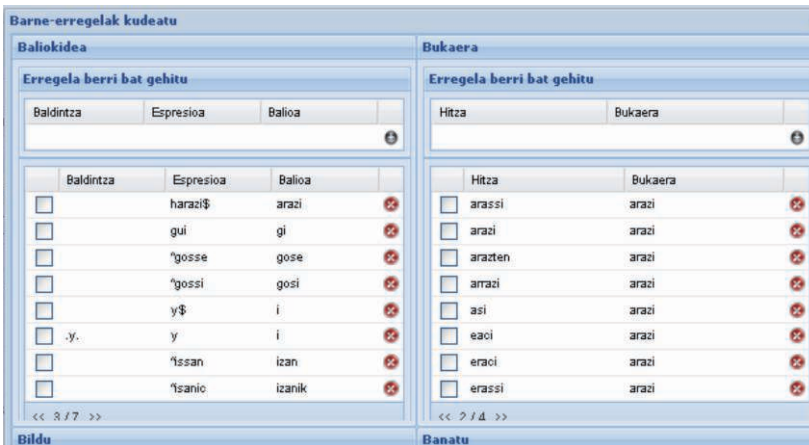
6. CorpusLem-en barne-erregelak

c) Bildu araua: badira bereiz idazten diren baina batasun bat duten esamoldeak eta bestealde bereiz idaz daitezkeen hitz elkartuak. Horietako pare bat aipatzearren: badugu batetik ‘harik eta’ esamoldea testuan gehienetan agnic eta bezala agertzen dena. Arau hau gabe tresnak bi hitz bezala hartuko lituzke; hori gerta ez dadin sortu da arau hau. Beste kasu bat aipatzearren ‘aitaso-amaso’ hitz elkartuaren eta antzekoen kasua dugu; testuetan beste grafia batzuen artean aitasso eta amassouak bereiz idatzita ere agertzen dira. Horrelakoetan “aitasso-amassouak” dela ulertu behar du tresnak eta hori dela eta sortu da araua. Mota honetako 26 arau erabili dira ikerketa honetan.