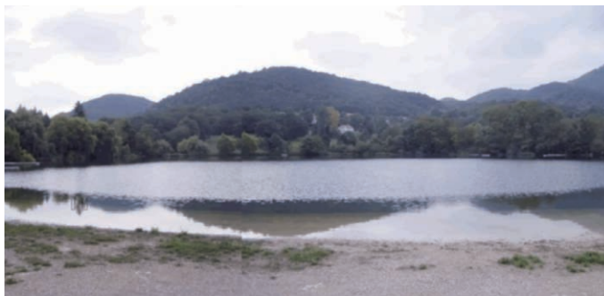
4. Barbazaneko lakua