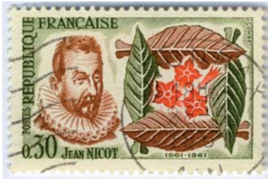
Timbre créé en 1961 par Jacques Combet.

cins – à Lisbonne, plusieurs gentilshommes de la cour avaient goûté avec succès de ce remède des indiens. Le médicament fit miracle, et sa mode fut lancée dans toute l'Europe 10 .