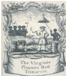
Gravure publicitaire d'une compagnie de tabac, Virginie, sud des États-Unis, XVIII e siècle.

merce triangulaire et de trafic d'esclaves, la main d'œuvre locale ayant été décimée et épuisée par les maladies et les mauvais traitements. L'Angleterre comprit rapidement que le commerce du tabac serait une source de profit inépuisable et plus rentable que l'exploitation de l'or des Amériques. Les Anglais installèrent des plantations de tabac en Virginie et résolurent de s'emparer de l'île de Tobago, frappant au cœur la production espagnole du tabac. La France intervint sous prétexte de protéger ses alliés espagnols... Avant de mourir par le tabac, on tuait pour le tabac.