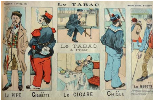
Imagerie d'Épinal, n° 4027 bis, Pellerin imprimeur.