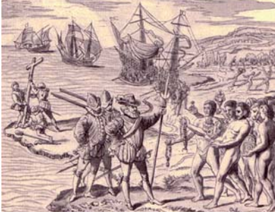
Premier débarquement de Colomb aux Indes occidentales. Gravure du XVI e siècle.

12 octobre 1492, matin : la Santa Maria, la Pinta et la Niña accostent après soixante et onze jours de navigation et d'incertitude. À défaut des maisons aux toits d'or regorgeant d'épices promises par Marco Polo dans son Livre des