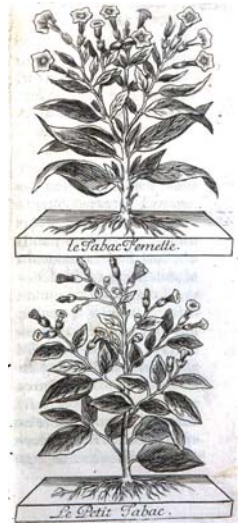
De Prade, Histoire du tabac , Paris, 1677.