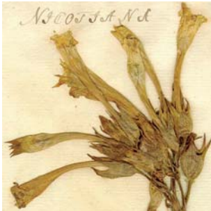
Fleur de tabac dans l' Herbier de Linné, XVIII e siècle.

Adam Lonitzer créa le genre Nicotiana dans son Kraüterbuch (1582). La proposition fut retenue par le botaniste Jacques Daléchamps qui dans son Histoire générale des plantes (1586), illustre le chapitre « Du Petum ou Herbe à la Reine » par une gravure intitulée Nicotiane ou Tabacum . La terminologie fut reprise par Tournefort en 1719 ( Institutiones rei herbariae ), et Linné consacra définitivement cette appellation en l'intégrant dans son système binomial sous le nom de Nicotiana tabacum dans son Species plantarum , en 1735.