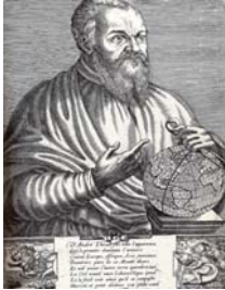
André Thévet (1516-1590). Portrait de Thomas de Leu, 1586.

et polygraphe, qui semble avoir été le premier à acclimater la plante en France, en Charente. Thévet, placé à dix ans, contre son gré au couvent des cordeliers de sa ville d'Angoulême, avait le goût de l'aventure. Après un premier voyage au Levant, on le retrouve en 1555, aumônier de l'expédition de Villegagnon, chevalier de Malte et vice-amiral de Bretagne chargé par le roi Henri II de fonder une colonie au Brésil : l'éphémère France Antarctique. Il visita le Nouveau Monde : parti du Havre, il accosta sur un îlot de l'embouchure du