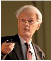
Richard Peto.

Peto. C'est un travail d'épidémiologie d'autant plus remarquable qu'à l'époque il n'y avait pas d'ordinateur : il fallait remplir des tableaux, dossier après dossier. La recherche s'est faite en deux étapes. En 1948, Doll a repris les dossiers de cancers du poumon sur dix ans et s'est aperçu qu'il s'agissait à plus de 90 % de gros fumeurs. À partir de ce constat, il eut l'idée très novatrice de constituer une cohorte et de la suivre sur une longue durée. En l'occurrence, il enrôla ses collègues médecins. En 1951, tous les médecins de Grande-Bretagne reçurent un courrier indiquant que l'on venait de mettre en évidence que fumer la cigarette est selon une très grande probabilité responsable du cancer du poumon, et les invitant à répondre à un questionnaire sur leurs habitudes en matière de tabac. À partir des réponses obtenues, Doll constitua une cohorte de 35 000 médecins qu'il sépara en deux : les fumeurs qui continuaient à fumer et ceux qui s'arrêtaient. Cette étude a une durée inhabituelle : en 2004, Doll a présenté les courbes de survie de ses cohortes de médecins restés fumeurs ou ayant arrêté de fumer, avec un suivi de 50 ans. Ce travail remarquable a démontré avec éclat que la cigarette est très fortement impliquée dans le cancer du poumon et les maladies bronchiques, mais aussi dans d'autres types de pathologies, et qu'elle réduit nettement l'espérance de vie.