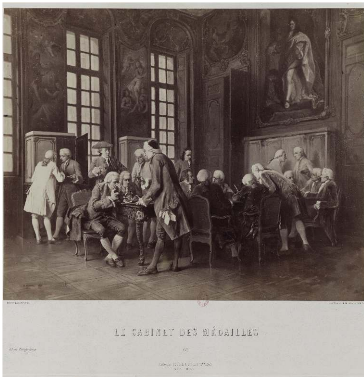
GRAVURE D'APRÈS LE TABLEAU PEINT AU SALON LOUIS XV, DÉPARTEMENT DES ESTAMPES CL. BNF.