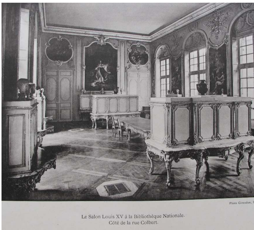
JEAN BABELON, 1927, LE CABINET DU ROI OU LE SALON LOUIS XV DE LA BIBLIOTHÈQUE NATIONALE, PL. III.