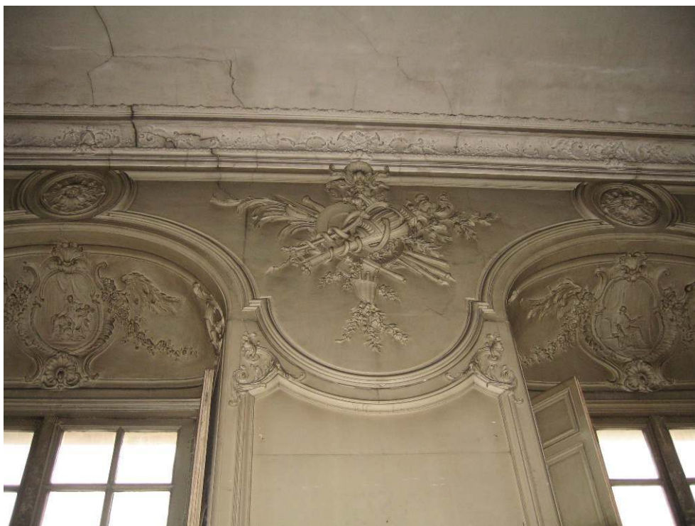
CL. FELICITY BODENSTEIN.

Ill. 2 : Un trumeau avec trophée et corniche de l'ancien salon Louis XV de 1741 à l'hôtel de Nevers, encore en place