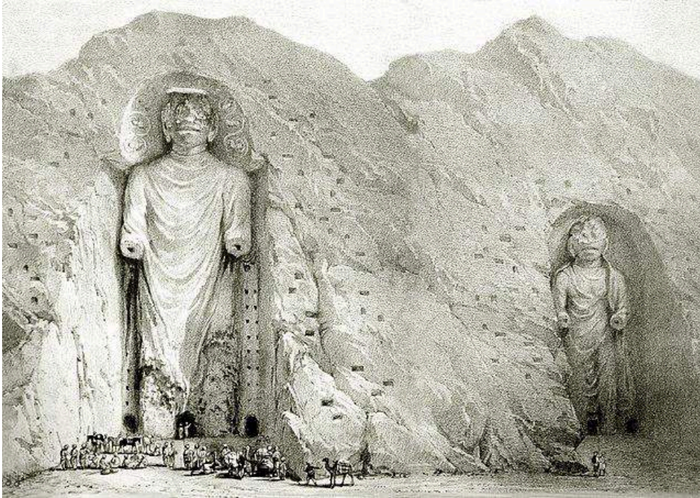
Gravure de L. Haghe tirée des Travels into Bokhara d'Alexander Burnes, London, 1834.