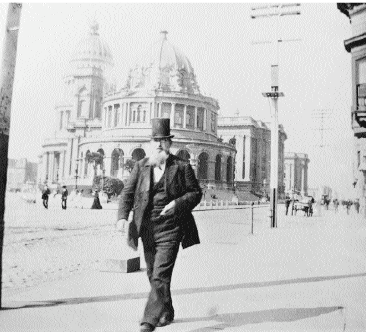
Uncle Sam