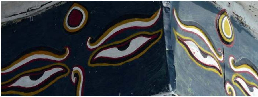
Fig. 4 Yeux du Bouddha dessinés au sommet d'un stupa, Kirtipur, Népal.

Bien d'autres figurations divines, de type métonymique ou symbolique, prennent place dans la religion néwar. À commencer par les yeux de déités : yeux en amande du Bouddha regardant dans les quatre directions peints en haut des stupas, yeux de Bhairav considérablement agrandis ornant une paroi verticale élevée derrière l'autel (Tika Bhairav), yeux prédessinés, appelés drishti (litt. : « vue », « vision »), collés sur les pierres symbolisant des puissances sacrées à l'occasion des offrandes. Citons aussi les pieds de dieux ou les sandales ( pâdukâ ) de religieux figurant l'ensemble du corps, ainsi que tel phallus ityphalle renvoyant à l'image priapique de Bhairav (dans la ville de Dolakha). Ces exemples peuvent être considérés comme des processus de figuration anthropomorphique élémentaire. Le fragment désigne l'ensemble.