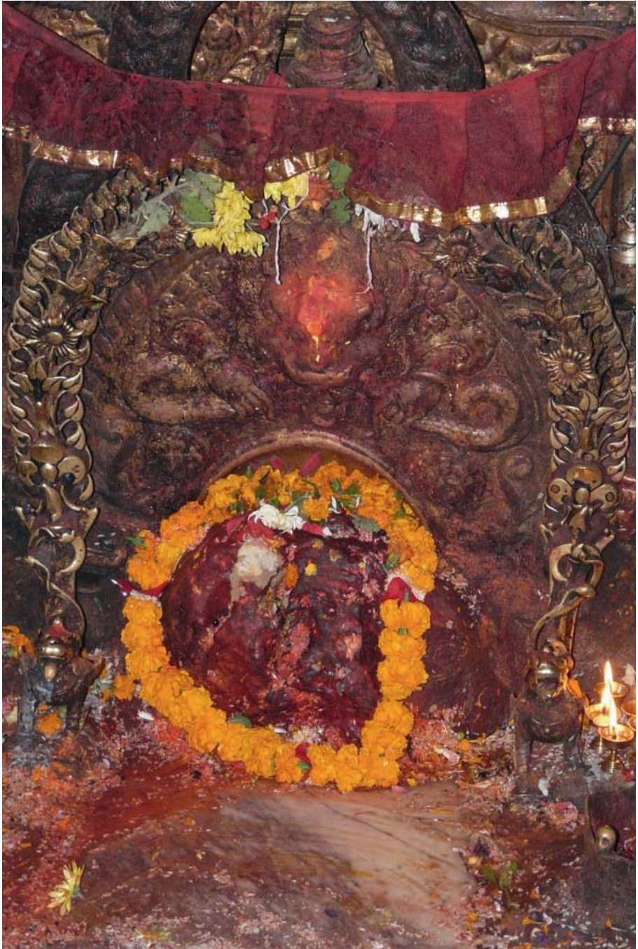
Fig. 2 La déesse Kankeshvari et ses acolytes représentés par des pierres non sculptées, temple de Kankeshvari, Katmandou, bords de la rivière Vishnumati.