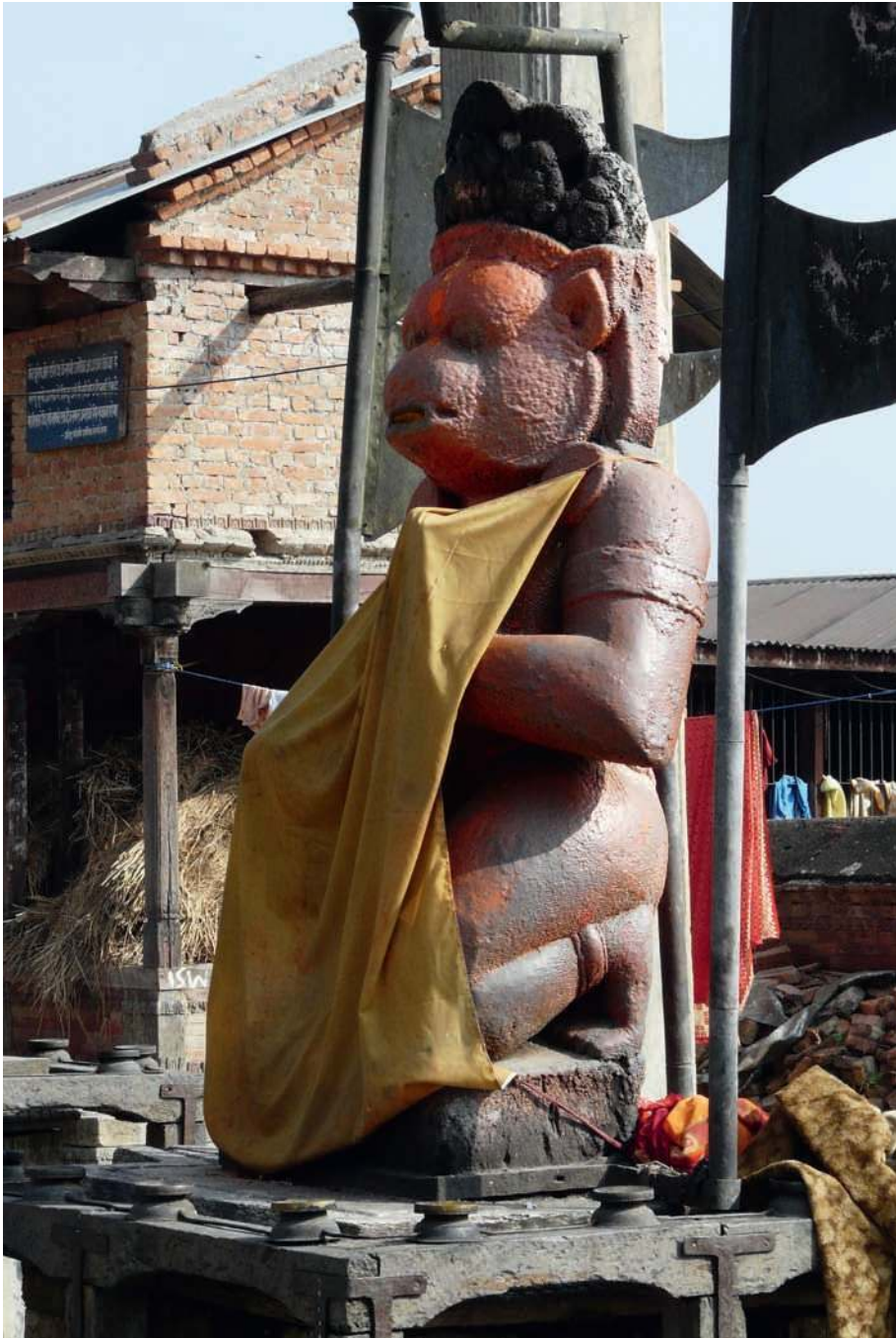
Fig. 3 Sculpture en pierre du dieu Hanuman, héros du Râmâyana, Sankhamul, district de Lalitpur.