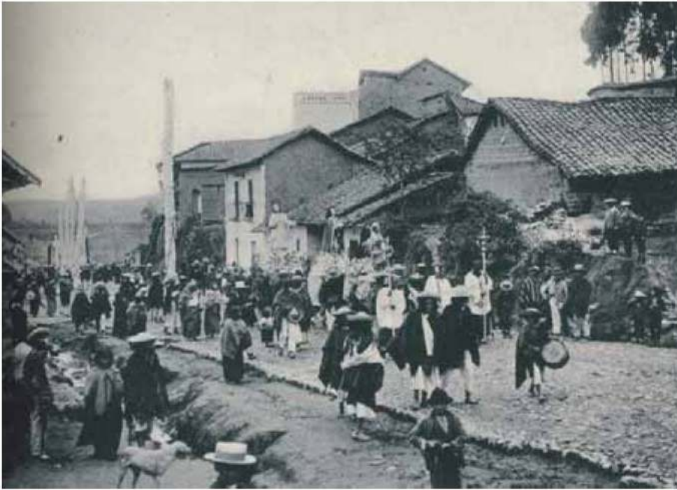
Illustration extraite de "Le christianisme en Équateur", L'Anthropologie , 1906, 17, pl. 1, fig. 1 [face p. 96].