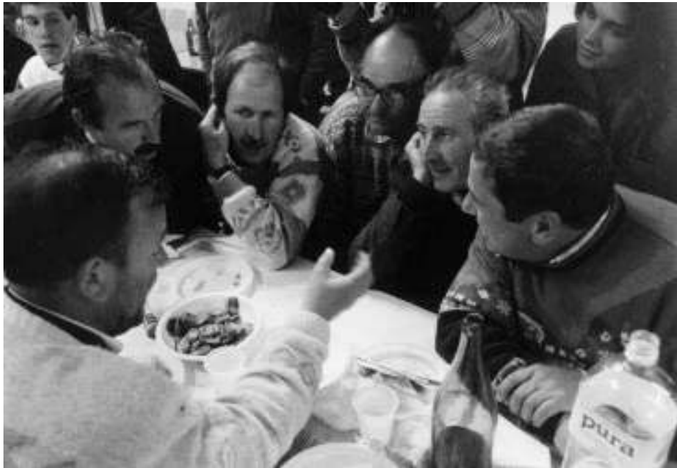
Photo 4. Autour d'une table.