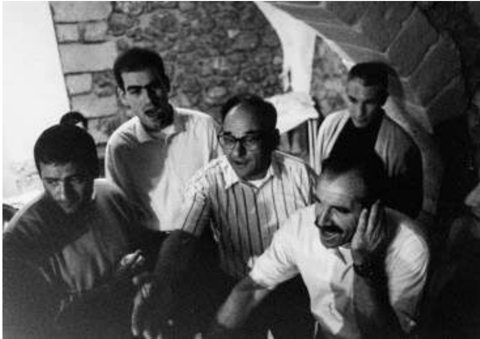
Photo 3. En compagnie.