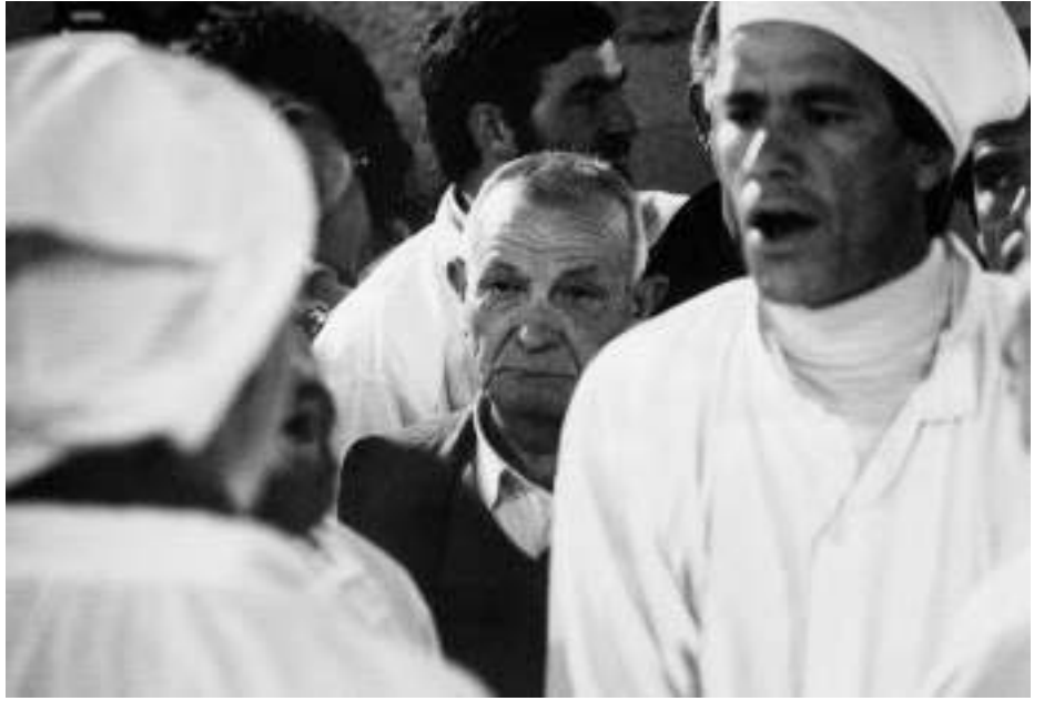
Photo 2. Durant une répétition.