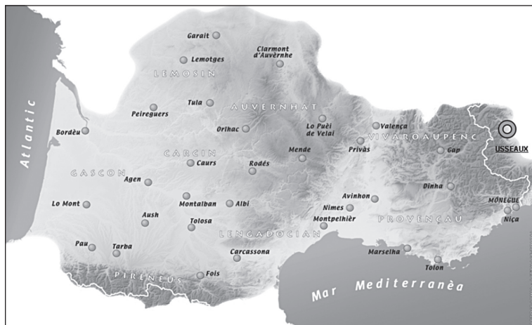
Carte 1. – Usseaux, commune occitane (Institut d'études occitanes, 2012).