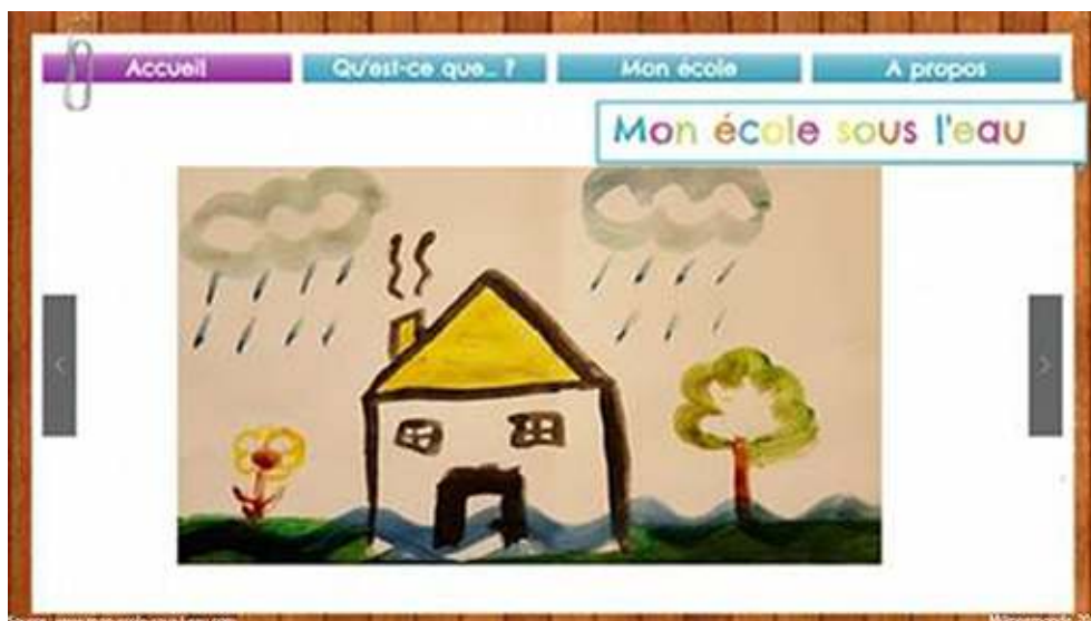
Figure 3. Interface de la page d'accueil de Mon école sous l'eau