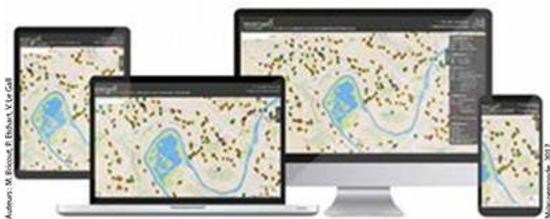
Figure 2. Un site multi-plateformes

Auteurs : M. Bricourt, P. Etchart, V. Le Gall