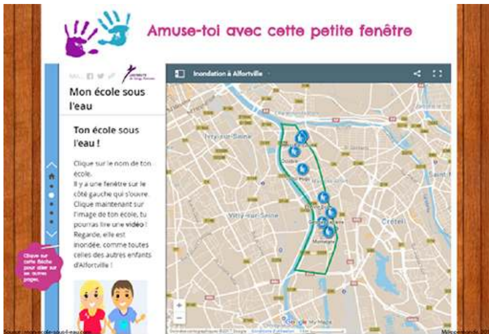
Figure 5. Vue de la carte interactive des huit écoles d'Alfortville