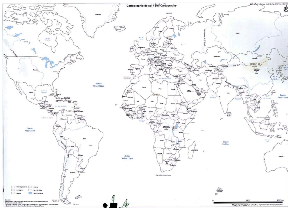
Figure 3. « Self Cartography » M me T.