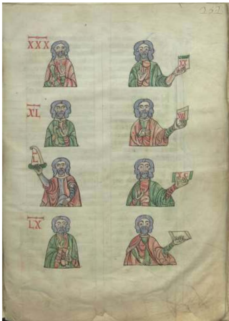
Fig. 3 Biblioteca Nacional de Portugal, Alcobacense 426, séc. XIII (fl. 252)