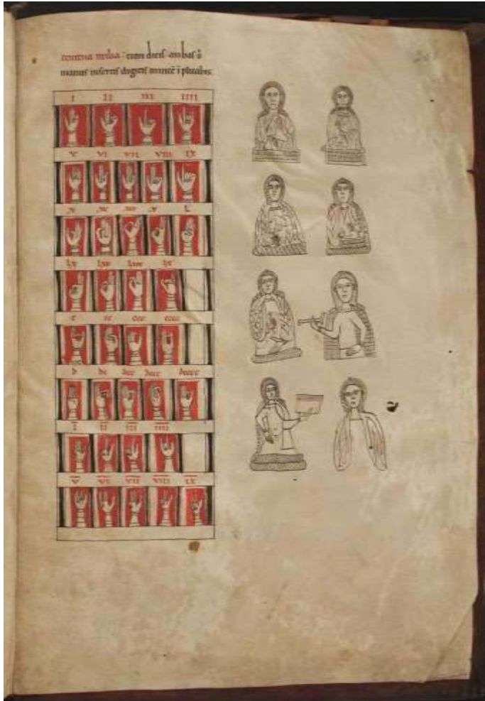
Fig. 1 Biblioteca Pública Municipal do Porto, Santa Cruz 8, séc. XIII (fl. 180)

das correspondências de autores, a par do estudo da ornamentação e das variações textuais, pode dar mais consistência a qualquer uma das alternativas que se sugeriram, permitindo que se prossiga com a investigação em busca das certezas possíveis.