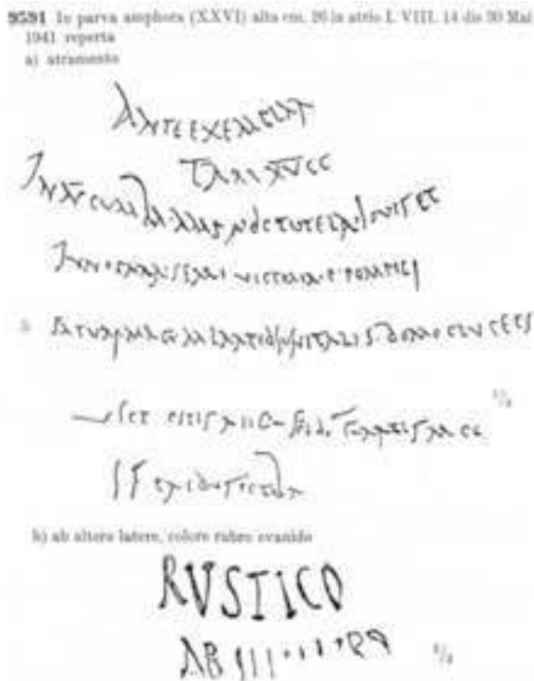
Fig. 2 - Le texte publié au CIL, IV.