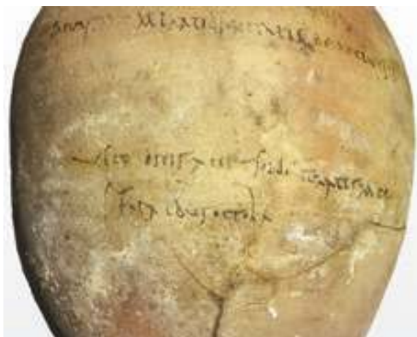
Fig. 6 - L'inscription CIL, IV, 9591, partie inférieure.