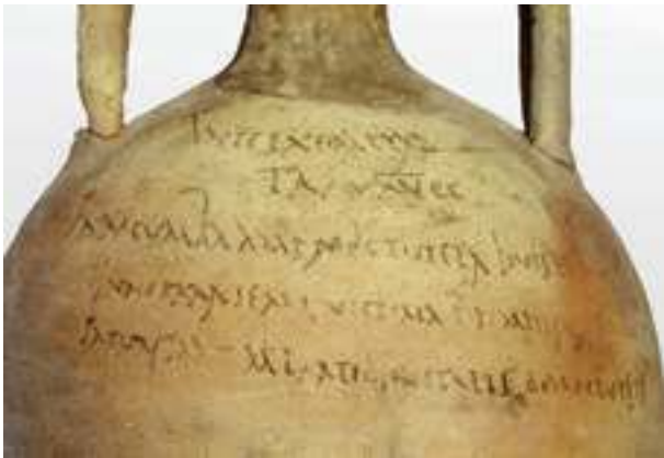
Fig. 3 - L'inscription CIL , IV, 9591, partie supérieure.

Vect(ura) Ostis a(...) IIC- (duobus centesimis) sōl(uen)do / [En marge] Gratis m(odii) CC (ducenti) / S(ine) F(raude) pr(idie) Idus octobr(es)