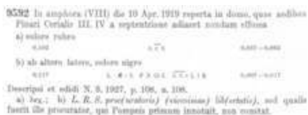
Fig. 8 - L'inscription CIL, IV, 9592.