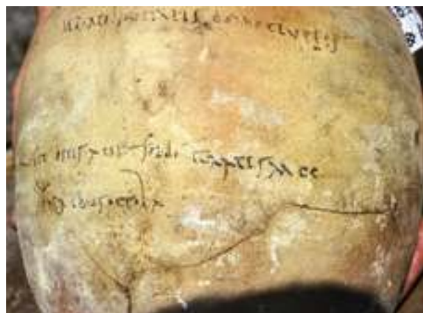
Fig. 5 - L'inscription CIL, IV, 9591, partie inférieure.

L'espace entre les deux parties de l'inscription est plus important que le dessin de M. Della Corte ne le faisait voir. Les lignes 6 et 7 ne sont pas de la même main que les précédentes.