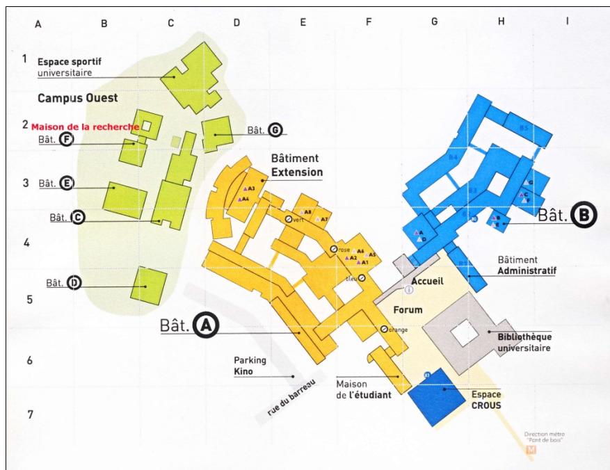
Situation de la Maison de la recherche (Bât. F) sur le campus de Lille 3