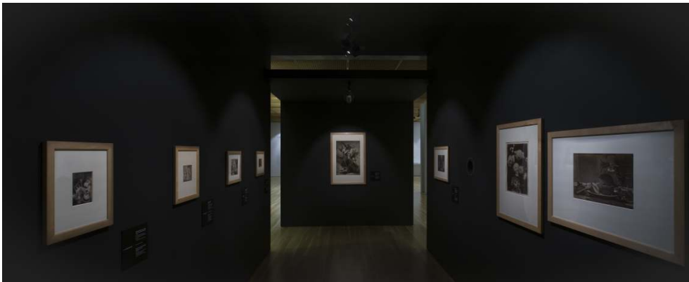
Fig. 6 - Unidade expositiva As próprias coisas: o choque da fotografia .