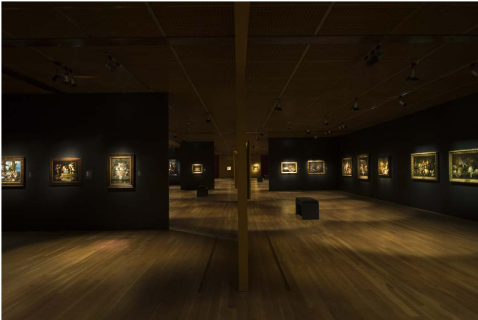
Fig. 2 - Vista parcial da primeira parte: séculos XVII-XVIII.

Esta primeira parte da Natureza-Morta foi pensada já em contraponto com a outra. Enquanto esta é ouro e preto, a próxima gostava que fosse prata e branco. Se utilizar o preto é como ausência, uma não-cor. Este preto é cor, o outro é um vazio, uma ausência. E enquanto este espaço tem uma força centrífuga maior, o outro quero que seja com uma força centrípeta, a pulverização do olhar... Enquanto aqui há géneros, há temáticas, há subgéneros: com mesa-sem mesa, com pão-sem pão, com autorretrato, grotesco, não-grotesco. No século XX, que o século anterior prepara, cada um corre por si, um Cézanne é um Cézanne. Todos estão contra todos e as maiores inimizades nascem entre os que são mais próximos - Matisse e Picasso... Nesta exposição o corredor central é um elemento aglutinador, todos os núcleos são satélites de um magma - existe uma lógica de sistema de planetas à volta do seu sol, da sua luz. Na próxima, quero o contrário - o eixo é desagregação. Gostava de poder tratar estas duas exposições como dois volumes de uma coleção (Piçarra 2010).