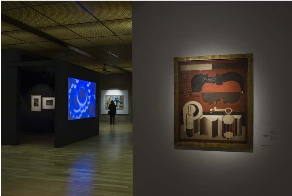
Fig. 7 - Dispositivo vídeo (à esquerda).

Nesta unidade, embora não constituindo exemplos de naturezas-mortas, assume particular relevância a inclusão dos filmes Film ist Rhythmus: Rhythmus 21 de Hans Richter (1921), Le Retour à la Raison de Man Ray (1923) e Ballet mécanique de Fernand Léger e Dudley Murphy (1924) uma vez que exercitam a questão do repensar a representação dos objetos.