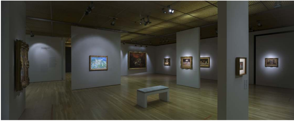
Fig. 3 - Vista parcial da segunda parte: séculos XIX-XX (1840-1955).