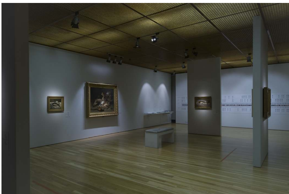
Fig. 9 - Banda cronológica (ao fundo).