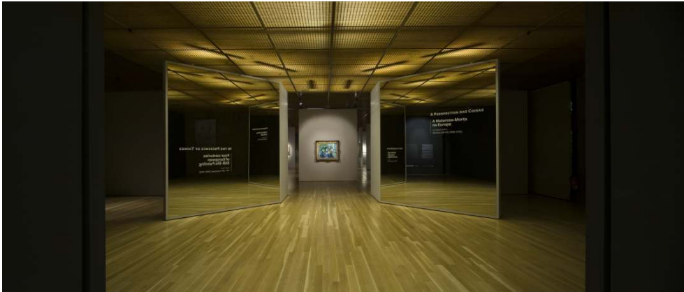
Fig. 4 - Jogo de espelhos.