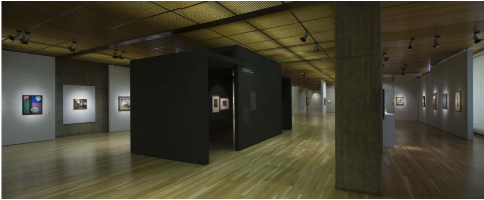
Fig. 5 - Percurso(s) da exposição.