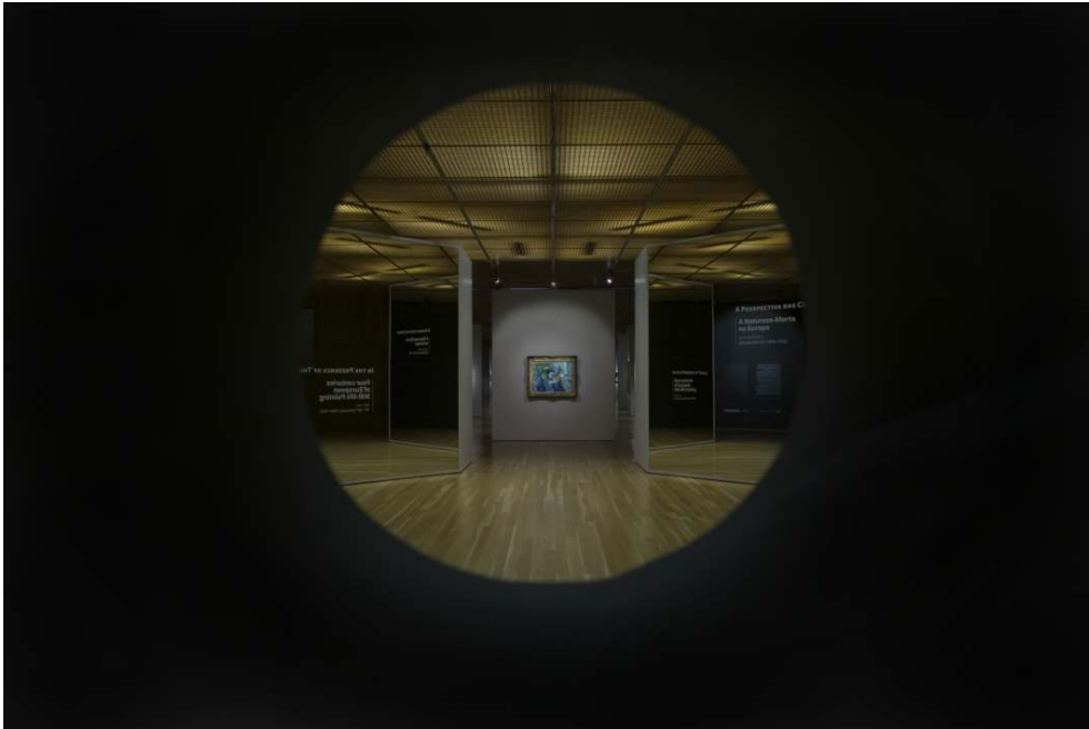
Fig. 1 - VISTA DA ENTRADA DA EXPOSIÇÃO.